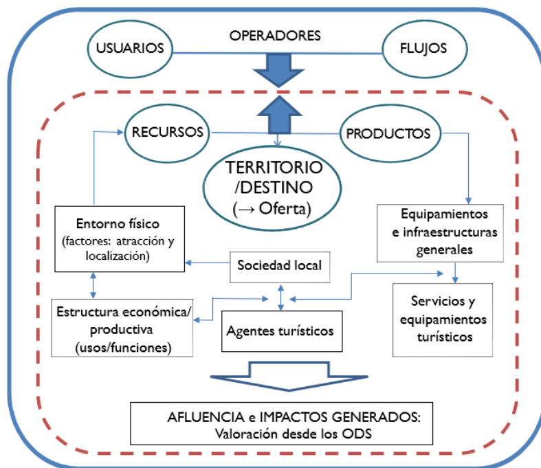
Figura 4. El territorio turístico desde una perspectiva sistémica

consonancia con la visión aportada en la asignatura de GT para el conjunto del sector turístico como un fenómeno complejo (estrategia 5 de la STP).