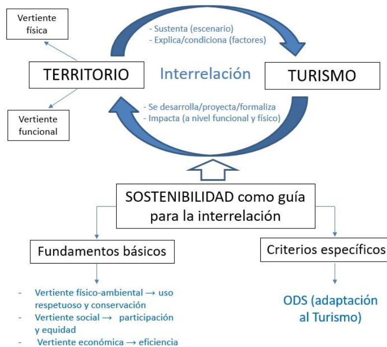
Figura 3. La relación básica turismo-territorio y su necesaria consideración desde la sostenibilidad