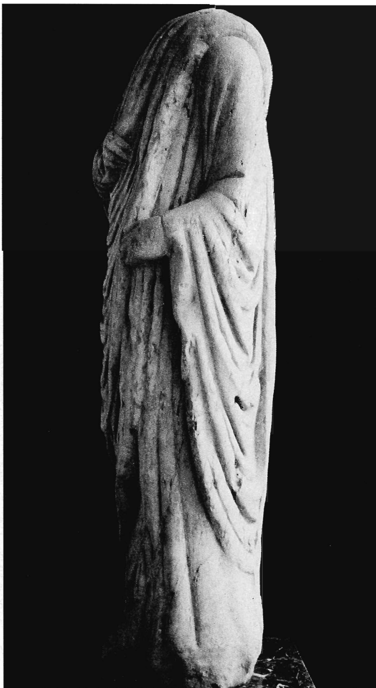
Lám. V.- Estatua togada n.º 2: lateral izquierdo.