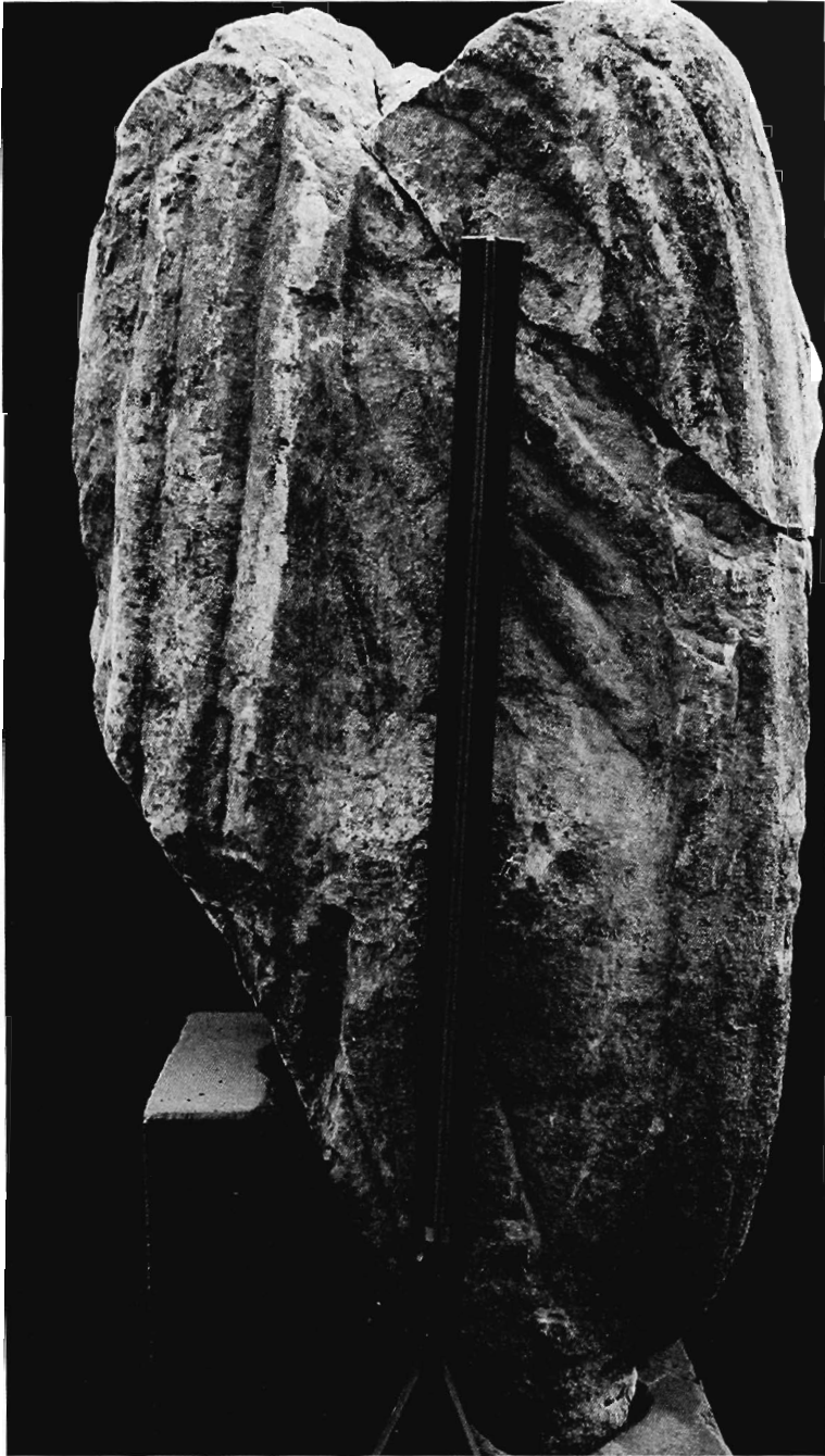
Lám. VII.- Estatua togada n.º 3: parte posterior.