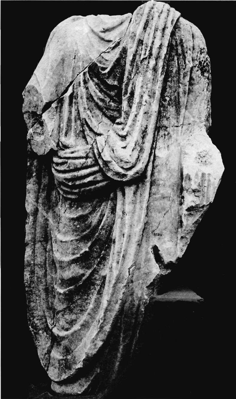
Lám. VI.- Estatua togada n.º 3: parte anterior.