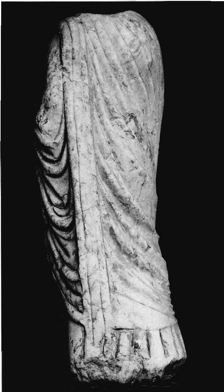
Lám. III.- Estatua togada n.º 2: parte posterior (Foto: Alejandro Montejo).