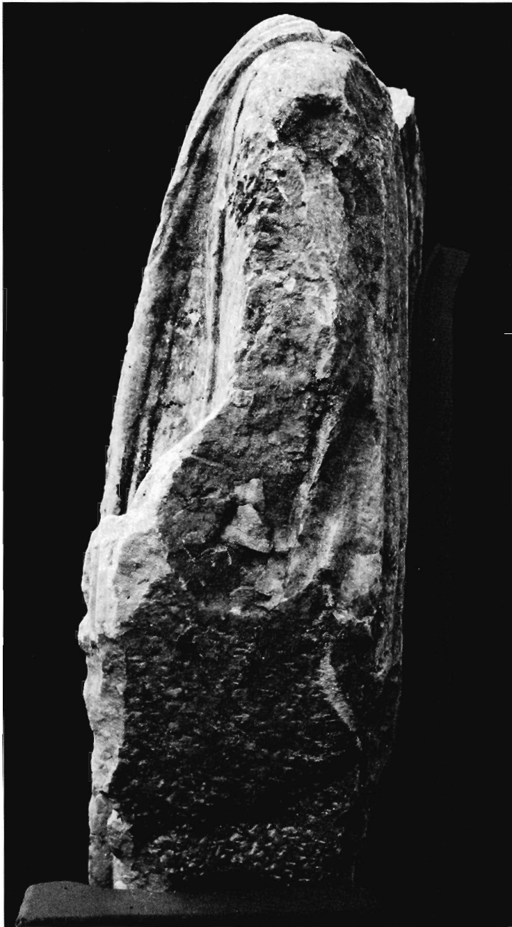
Lám. IX.- Estatua togada n.º 3: lateral izquierdo