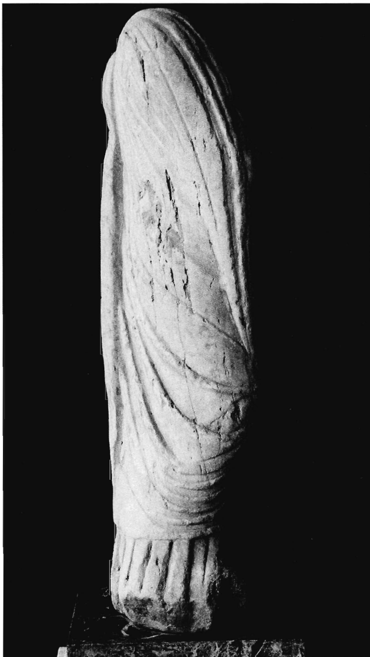
Lám. IV.- Estatua togada n.º 2: lateral derecho.