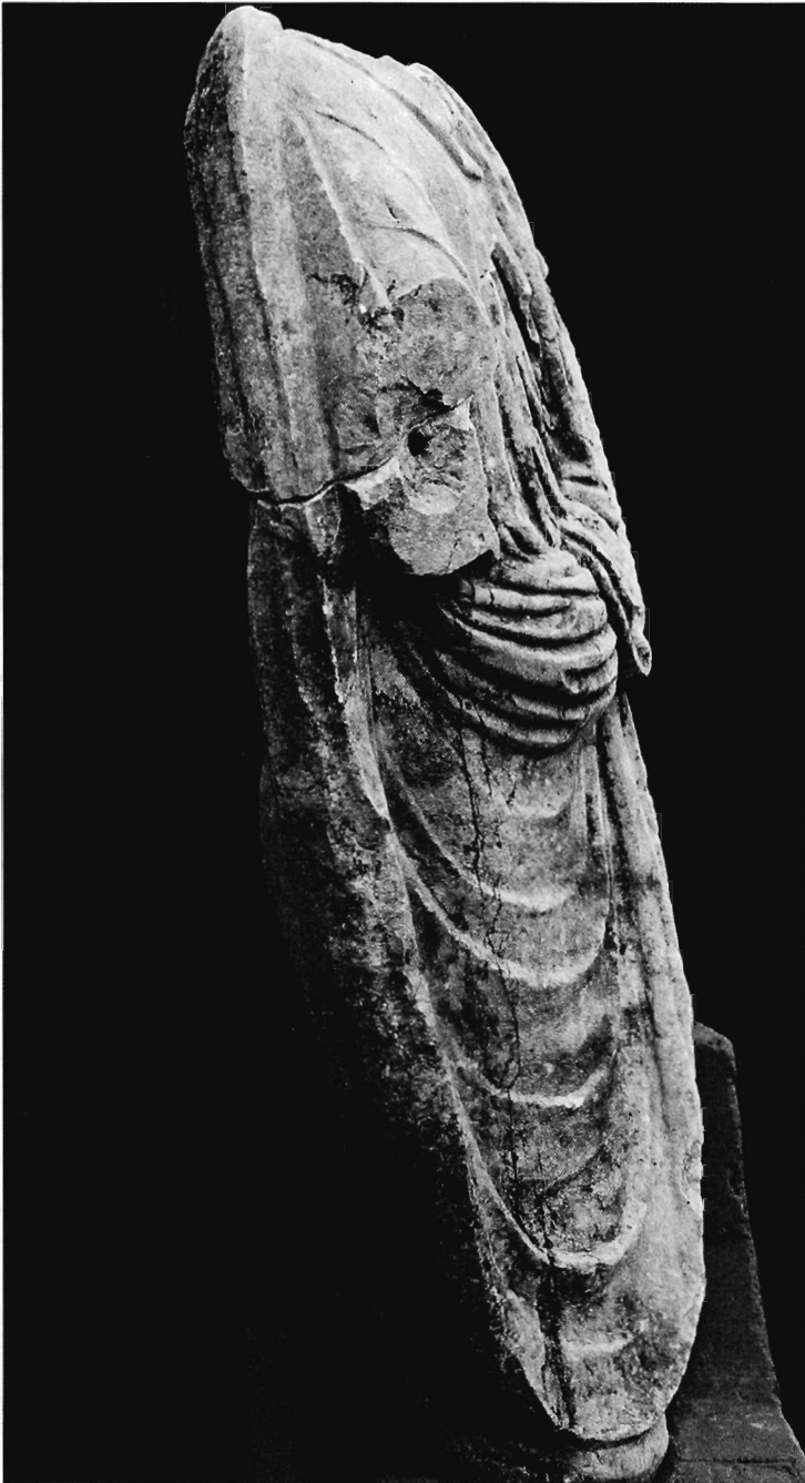
Lám. VIII.- Estatua togada n.º 3: lateral derecho.