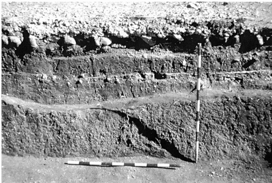
Fig. 3. Niveles prerromanos bajo el suelo de las termas.