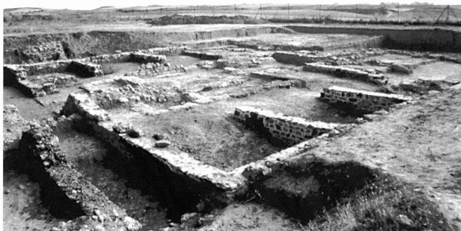
Fig. 2. Macellum , desde el ángulo sur.

que se emplaza, entre el 130 y el 160 de nuestra Era 23 . De proporciones y distribución muy parecida también es el de Thibilis en Numidia 24 , que presenta una planta de 15,7 por 13 mts. y un patio de 5 por 3; la distribución de las tabernae alrededor del patio —también 6— es similar al de nuestro ejemplar y su cronología pareja ya que se data en el siglo II, sin más precisiones, aunque hay que constatar que se trata de excavaciones bastante antiguas 25 .