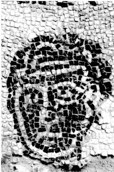
fig. 2: Détail du visage de Liber.

L'inscription sur plaque de marbre —une tabula lusoria — commentée par A. Ferrua dans son article cité note 5 concerne aussi un cocher du nom de Liber, mais il est plus difficile d'affirmer qu'il s'agit du même homme que dans les mosaïques d'Ostie et de Rome.