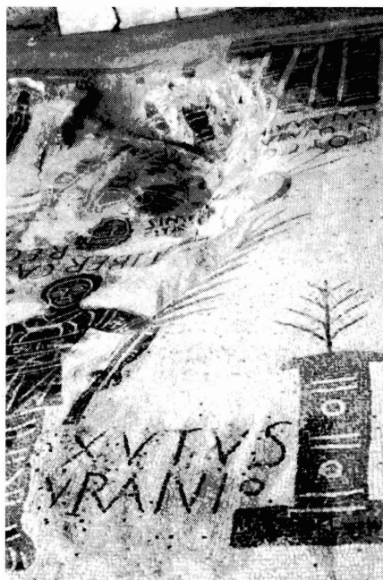
fig. 4: Détail de l'inscription du cocher Xutus (cliché de l'A.).