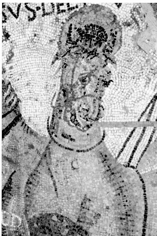
fig. 5: Mosaïque de Mérida, calle Holguin, vue de DELFICVS.

Pour terminer ce tour d’horizon, on peut remarquer qu’à la fin de l’Antiquité, l’Italie est soumise elle aussi à