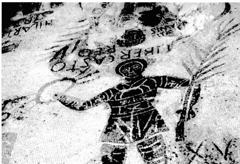
fig. 3: Détail du cocher Xutus.

On n'y trouve pas non plus de référence à l'édifice dans lequel se sont déroulées les courses successives dans lesquelles les cochers ont remporté divers prix, mais il s'agit vraisemblablement du Circus Maximus .