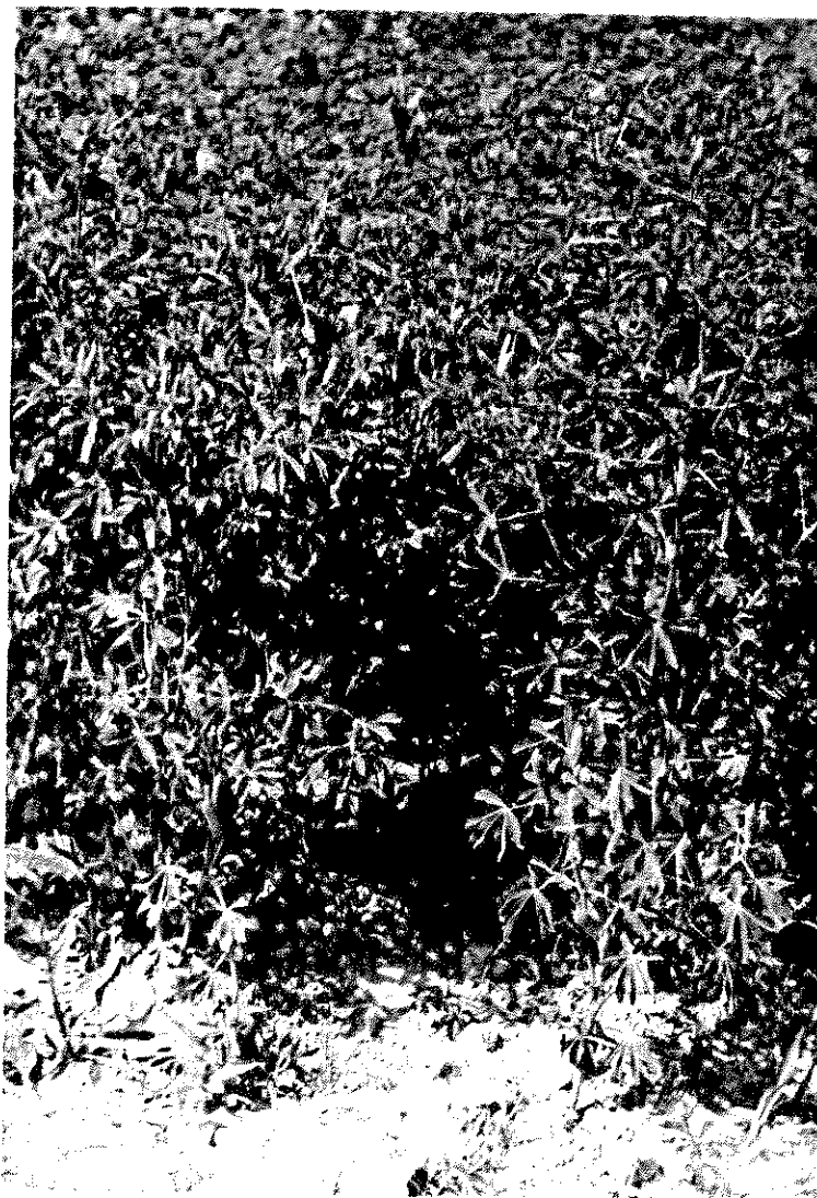
FIGURA 1. Vista parcial de cultivo de plantas frondosas de L. albus , "Baeticus", en parcelas experimentales de "Cortijo Rubio" (Villarubia de Córdoba).