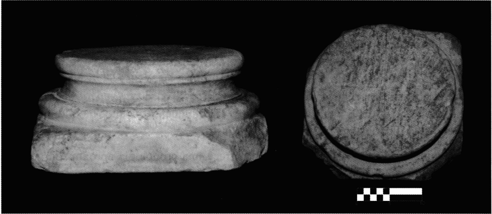
Lámina 1: Baza de mármol blanco sin decorar.

similares características que fue recuperada en la denominada Cuesta del Espino, en el término de Posadas (Córdoba), que presenta la misma molduración que la nuestra 8 .