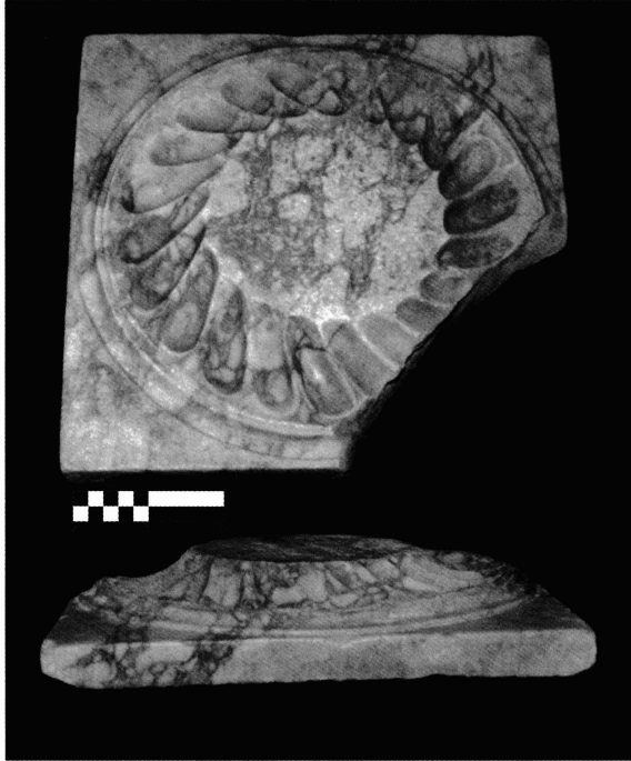
Lámina 2: Basa de giallo antico decorada con gallones helicoidales.

Debemos buscar en los detalles de la decoración de la pieza la categoría y calidad de la misma. Se nos presenta un imoscapo compartimentado en canales, finalizados de manera circular, que giran sobre su eje en dirección contraria a las agujas del reloj, adquiriendo por ello una especial forma helicoidal. Los canales están separados por aristas dobles formadas por la unión de los bordes de los gallones; aristas que generan en su parte final puntas de flecha. Este tipo de fuste con canal helicoidal se caracteriza por su marcada función ornamental y por su escasa expansión a través del occidente romano, cuya presencia se justifica para ámbitos domésticos o en edificios teatrales.