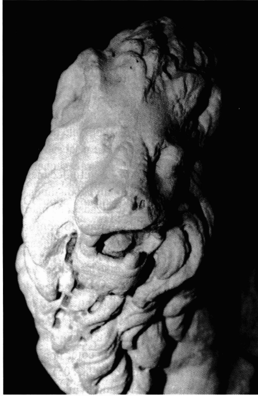
Lámina 7: Detalle de la cabeza del león.

y verismo los pliegues de la piel y el pelo. Naturalismo que podemos apreciar en el tratamiento del lomo del animal que muestra las costillas bajo el pelaje y la zona blanda del estómago. Del mismo modo, este intento de fidelidad al modelo real se puede comprobar en el interés del autor por representar la pelambre colgante que recorre la parte inferior del cuerpo y la trasera de las patas delanteras. Estas características contrastan con el tratamiento dado al león romano 21 de Málaga (BAENA DEL ALCÁZAR, 1987, 1989) analizado por Díaz Martos (1960, 225-228) y situado cronológicamente entre la segunda mitad del siglo II d. C., y finales del III.