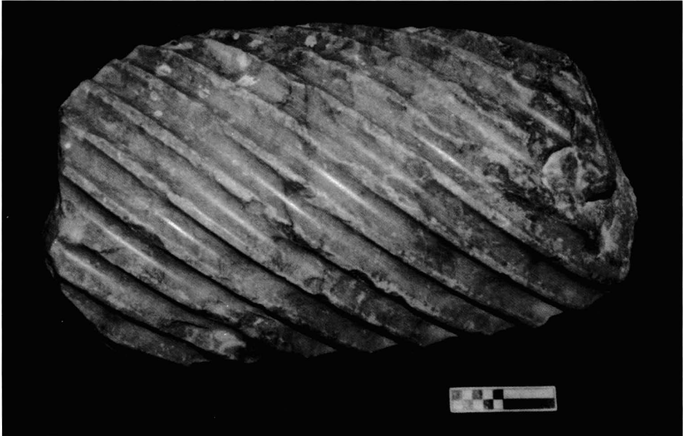
Lámina 4: Fuste de mármol de color con canales helicoidales

color", posiblemente importado, decorado con canales helicoidales de sección semicircular separados por aristas rectas. Este tipo de fuste aparece, hasta el momento, en Colonia Patricia realizado en mármoles de importación 14 . En el Occidente romano presenta una escasa propagación y cuando aflora, lo hace con la finalidad de embellecer ambientes domésticos o espacios reservados a espectáculos de entretenimiento (MÁRQUEZ, 1998, 121), no ocurriendo lo mismo para el oriente donde estas piezas se nos muestran con una enorme difusión y una larga vida como demostró Chapot (1907).