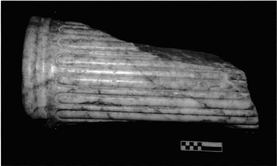
Lámina 5: Fuste de mármol cipollino.

El primer capitel 17 que analizamos está realizado en mármol y su análisis se ha realizado a través del estudio de la sección del mismo, con especial incidencia en el perfil del equino (GUTIÉRREZ, 1992, 22). Así podemos apreciar un ábaco delgado sin decorar, de forma cuadrangular, sobre el que apoya un equino con perfil de arco de circunferencia y un collarino con dos listeles sobre los que descansa el sumoscapo de la columna, que aparece liso. Tiene gran semejanza con el capitel I 1 estudiado por Schafer (1999, 689-702) y que incluyó dentro del Grupo 1.