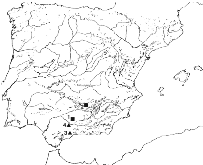
Fig. 2.- ■ Ruedas caladas con representación de caballo. ▲ Con representación de jinete: 1. Monturque (Córdoba); 2. Santa Elena (Jaén); 3. Cártama (Málaga); 4. Puente Genil (Córdoba). (Solo se incluyen las de procedencia conocida).