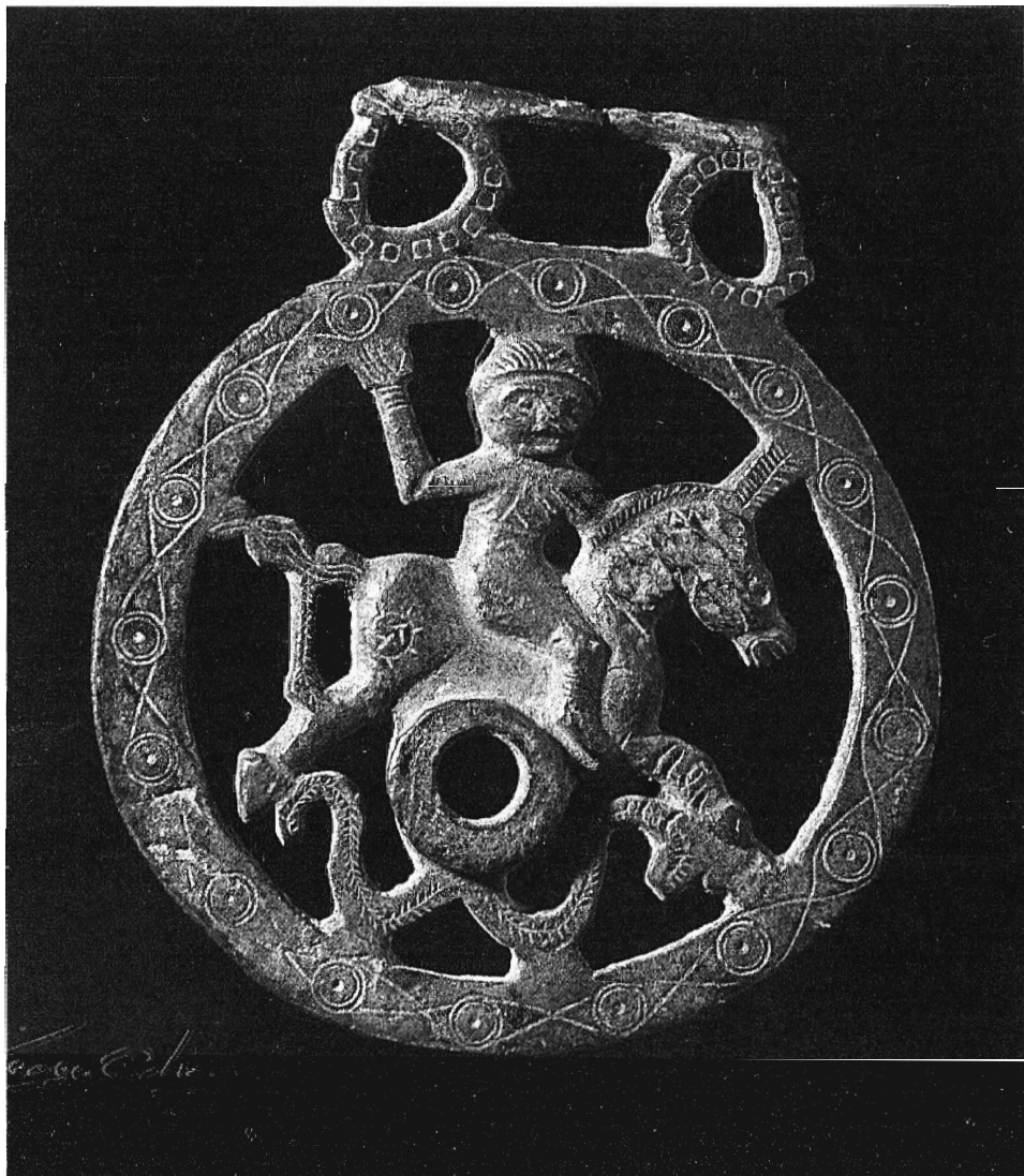
Lám. 1.- Rueda tardorromana procedente de Puente Genil