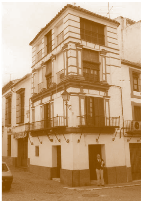
Laboratorio de la casa aneja a la Farmacia Losada. Carmona

La piedad popular sigue identificando mayormente la obra religiosa de Murillo con sus pinturas de la Inmaculada, realizadas durante el muy polémico periodo sobre este tema entre dominicos y franciscanos que le tocó vivir al pintor sevillano. La visión pictórica de la Virgen Inmaculada, ataviada con deslumbrantes ropajes, coronada de estrellas y con la luna bajo sus pies, tiene un trasfondo bíblico en el conocido texto del Apocalipsis de San Juan. Fue el maestro sevillano Pacheco quien en su Arte de la Pintura estableció las normas para la plasmación del misterio mariano de la Inmaculada: corona con doce estrellas en torno a su cabeza, túnica blanca, manto azul, aureola de luz, y la luna en cuarto creciente a sus pies. Además de Murillo, “el pintor de la Inmaculada”, los más famosos pintores (Roelas, Rubens, Ribera, Zurbarán, Velázquez, Valdés Leal...) y escultores (Martínez Montañés, Alonso Cano...) pintaron y esculpieron entonces imágenes de la Inmaculada que se convirtieron en modelos para la posteridad.