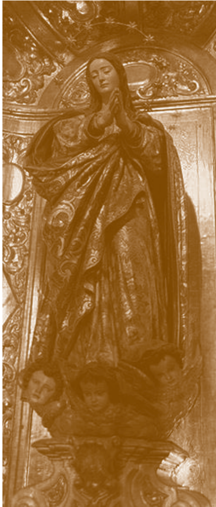
Inmaculada, (La Cieguecita) . Juan Martínez Montañés. 1629-1631. Catedral de Sevilla

San Buenaventura, llamado Doctor seraphicus por su misticismo, ocupa uno de los primeros puestos entre los teólogos del siglo XIII. Nació en Toscana y fue a París, donde enseñó filosofía y teología. Obispo, cardenal y general de los franciscanos, fue canonizado por el Papa Sixto IV. Otro de los más famosos filósofos y teólogos de la Alta Edad Media fue el Beato franciscano escocés Duns Scoto, apodado Doctor subtilis por su pensamiento penetrante y sutil, marcado por la inspiración agustiniana que suele caracterizar a los franciscanos. Vivió a finales del siglo XIII y comienzos del XIV y enseñó en Oxford, Cambridge, París