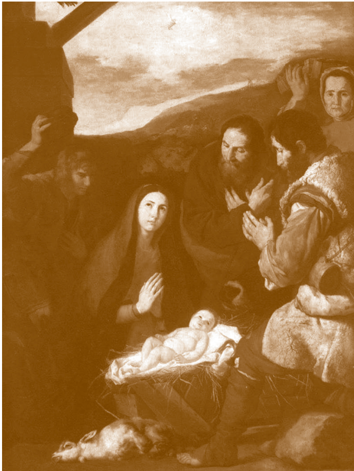
Adoración de los pastores . José Ribera, “el Españoleto”. 1650. Museo del Louvre, París

Sin exageración puede afirmarse que la Revolución geográfica, económica, alimentaria, lingüística... e incluso científica se inició con el Descubrimiento de América. Los Reyes Católicos —título concedido por el Papa Alejandro VI a Fernando II de Aragón e Isabel I de Castilla en 1494— recibieron a Colón a la vuelta de su segundo viaje en el Salón del Almirante del Alcázar sevillano. En una de sus paredes hay un cuadro con la primera representación pictórica que se hizo en Europa para conmemorar el Descubrimiento: la Virgen de los mareantes, en cuyo centro figuran los rostros del César Carlos, Cristóbal Colón y Américo Vespucio. Los restos de Cristóbal Colón descansan en el túmulo de la Catedral hispalense, y los de Américo, que se casó con la sevillana Isabel Cerezo, reposan también en Sevilla, pero se ignora en qué iglesia fueron enterrados.