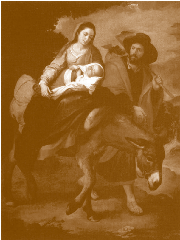
La Huida a Egipto. Bartolomé E. Murillo. 1648. Instituto de Arte, Detroit

Después de considerar el misterio del origen instantáneo y explosivo del Universo a partir de un huevo primigenio, la gestación de nuestro sistema solar, la aparición en nuestro planeta del Homo sapiens sapiens y la venida de Jesucristo, todos nos hacemos una y otra vez desde distintos ángulos y con muy diferentes