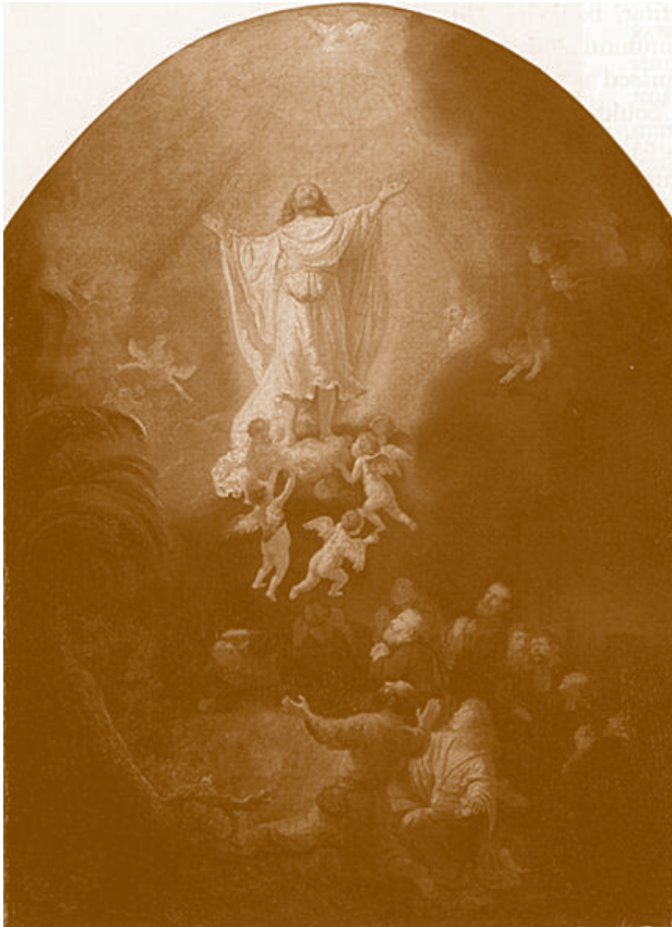
La Ascensión. Rembrandt. 1636. Alte Pinakothek, Munich

Veré este fuego eterno fuente de vida y luz do se mantiene.