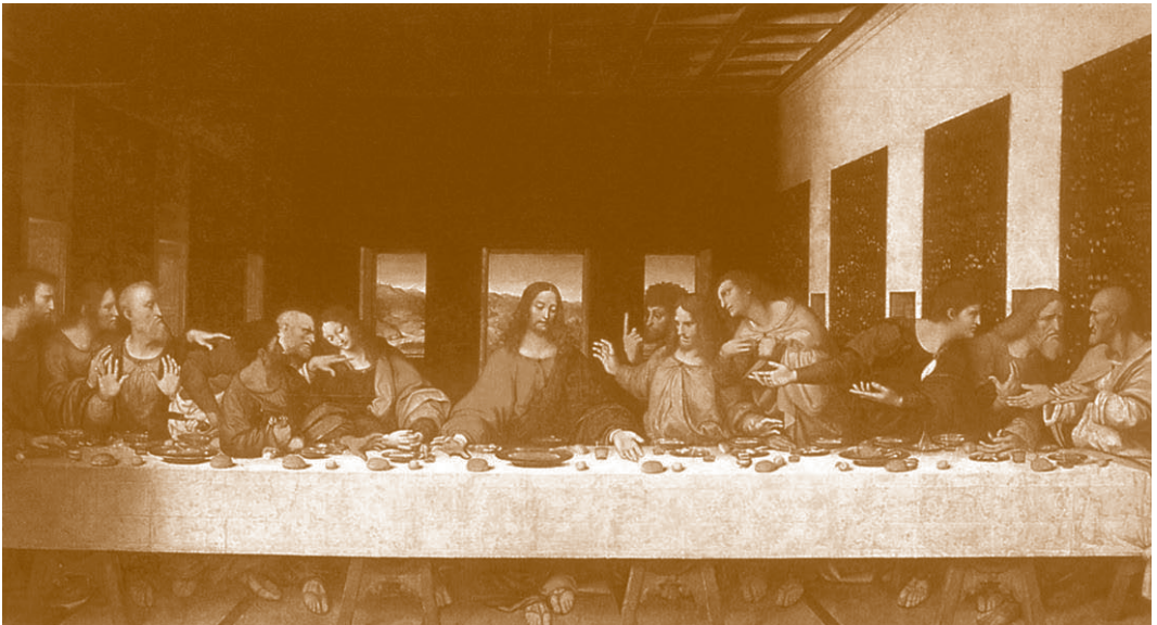
La Última Cena. Leonardo da Vinci. Siglo XVI. Museo Da Vinci, Tongerlo

Un vivo pajarillo volaba en una rosa. El alba era primorosa. Y, cual la luna matinal, se perdía en el sol nuevo y sencillo el ala de Gabriel, blanco y triunfal. ¡Memoria de cristal!