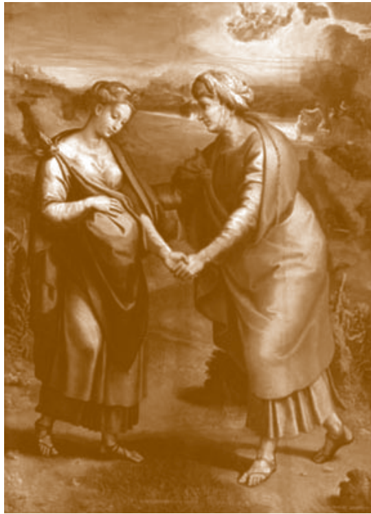
La Visitación. Rafael Sanzio. 1516. Museo del Prado, Madrid

globalización son hombres buenos, sabios, capaces, bien formados e intencionados, de todas las razas, civilizaciones y culturas, defensores insobornables de la Verdad y el Bien. El mal y la mentira son incompatibles con el Bien, la Verdad y la Libertad. La obediencia a la Verdad, la obediencia a Dios, guardar sus mandamientos es la primera y única libertad de la humanidad. Tenemos que encontrar todos juntos el sacrosanto camino de la Verdad y el Bien, dispuestos por doloroso que pueda sernos a renunciar al mal y a nuestras propias creencias e ideologías si se demostrara que estamos equivocados y no son verdad. Estas consideraciones pueden ayudarnos a limar muchas asperezas, a superar en el futuro obstáculos aparentemente insalvables que hoy dividen y enfrentan a la humanidad, y a conseguir que triunfen universalmente la Verdad, el Bien y el diálogo entre los hombres.