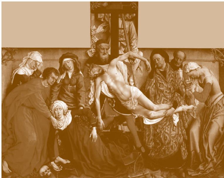
Descendimiento . Roger Van der Weyden. 1435. Monasterio de El Escorial

Simeón que esperaba la consolación de Israel, y el Espíritu Santo estaba en él. Le había sido revelado por el Espíritu Santo que no hallaría la muerte antes de ver al Cristo del Señor... Simeón tomó al niño en sus brazos y bendiciendo a Dios dijo: Ahora, Señor, puedes ya dejar ir en paz a tu siervo... y los bendijo y dijo a María, su madre: He aquí que éste está para caída y levantamiento de muchos de Israel y para signo de contradicción, y una espada atravesará tu alma para que se descubran los pensamientos de muchos corazones» (Lc 2, 22-35).