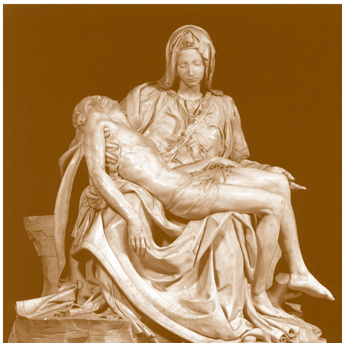
La Piedad. Miguel Ángel Buonarroti. 1499. Basílica de San Pedro, Roma

Los Hechos narran que, tras la Ascensión, los apóstoles se volvieron del Monte Oliveti al Cenáculo de Jerusalén, donde «perseveraban unánimes en la oración con algunas mujeres y con María, la Madre de Jesús» (Hch 1,12-14) hasta la venida del Espíritu Santo el día de Pentecostés (Hch 2,1-42), que la Iglesia invoca con especial intensidad con el ¡Ven, Espíritu Santo! ( Veni, Sancte Spiritus! ). Los judíos celebraban siete semanas después de la Pascua la fiesta de Pentecostés, que marcaba el fin de la recolección y en la que se hacía a Dios la ofrenda de los primeros panes. A