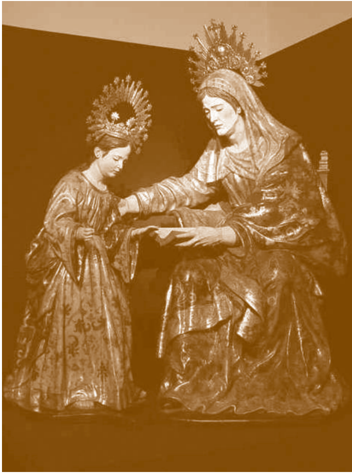
Santa Ana enseñando a leer a la Virgen. José Montes de Oca. 1726. Iglesia del Salvador, Sevilla

San Juan de la Cruz continúa sus romances con el misterio igualmente insondable del Verbo, Hijo único de Dios ( cf Jn 1,1-18). En el principio, antes de todos los siglos, existía el Verbo, y el Verbo era Dios y vivía en el seno de Dios. El Verbo es eterno y no creado, consustancial al Padre: