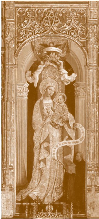
Virgen de la Antigua. Alejo Fernández. 1520. Retablo de la Capilla de Santa María de Jesús, Sevilla

ellos el amor y la verdad! Ciertamente estos deben ser nuestros mejores deseos: Que la gracia y el amor —la gloria con que María y su Hijo Jesucristo iluminaron hace veinte siglos e iluminan hoy el mundo llenándolo de esperanza— no sean infundadas e irreales y se queden en “verdades” utópicas, efímeras y trasnochadas, sino que por el contrario constituyan la propia esencia impulsora de la formación equilibrada y del buen comportamiento de la gran familia humana del futuro, que en crecimiento exponencial desde su inicio supera ya la cifra de cinco mil millones de personas.