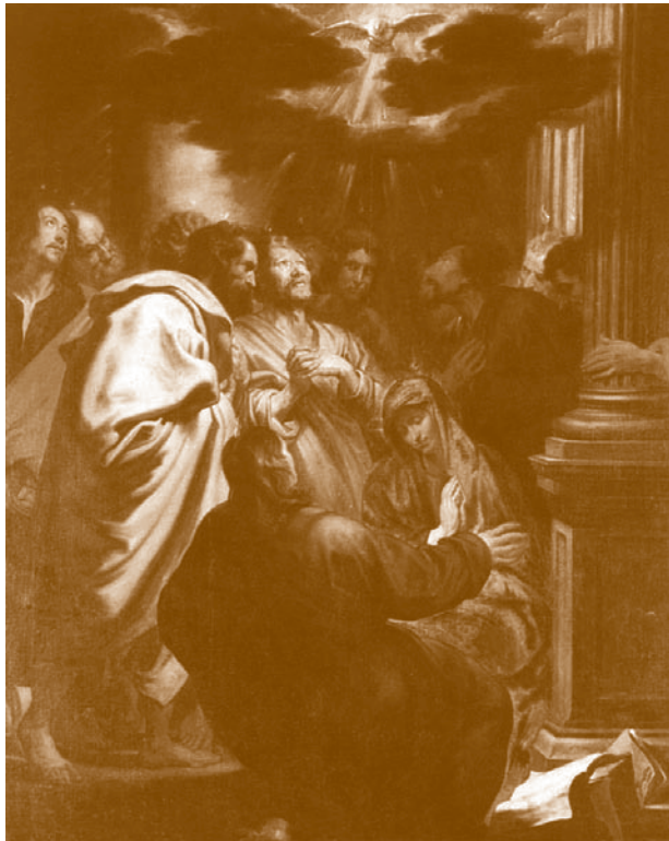
Pentecostés . Anthony van Dyck. 1618-20. Museo Staatliche, Berlín

en Belén, donde se consagró a la erudición y al ascetismo y murió el año 420. San Jerónimo es uno de los santos más representados en el arte occidental durante la Baja Edad Media y sobre todo en el Renacimiento y el Barroco.