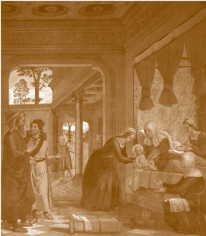
El nacimiento de la Virgen . Juan de Borgoña. 1509-11. Sala Capitular, Catedral de Toledo

Dios nos ha dotado de inteligencia, libertad y conciencia: libres de conocernos y amarnos, de ignorarnos e incluso odiarnos. ¿Por qué nos amenaza, hasta dominarnos y anularnos, el sentimiento trágico y amargo de la soberbia, la envidia, la maldad y la mentira? El genial físico judío-alemán, finalmente nacionalizado norteamericano, Einstein opinaba después de la terrible explosión de las bombas atómicas que «la ciencia sin religión es coja, y que la religión sin ciencia es ciega».