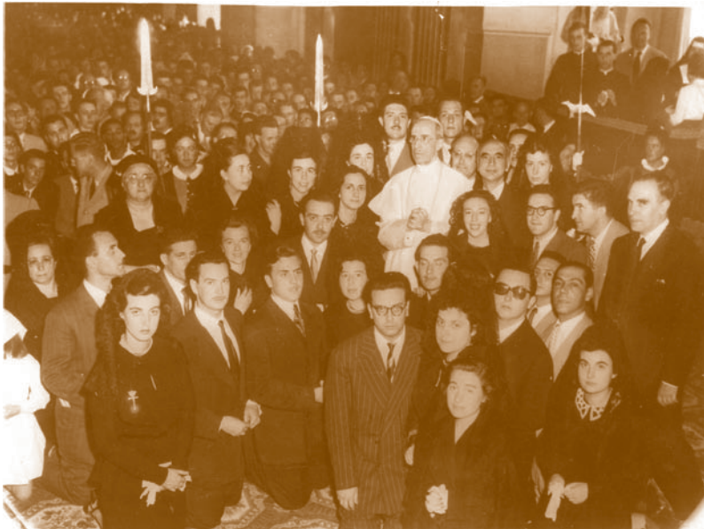
Audiencia de Pío XII a la Promoción de Farmacia de la Universidad Complutense. Roma (1952)

En otro plano, además de los padres salesianos también jugaron un papel importante en mi educación y formación los padres redentoristas, que celebraban sus cultos en la Iglesia de las Agustinas Descalzas y más asiduamente en la capilla de enfrente, donde tenían su Residencia. San Agustín y su madre Santa Mónica —que encauzó la vida desordenada de su hijo— son figuras excelsas del cristianismo. San Agustín fue, además de uno de los más grandes genios de la humanidad, padre de numerosos institutos antiguos y modernos que se han constituido siguiendo las directrices espirituales formuladas por él. Como mariólogo excepcional abordó en su amplísima obra —en la que destacan sus Confesiones y La ciudad de Dios — casi todos los temas marianos, entre ellos la virginidad y santidad total y perpetua de María y su maternidad divina. San Agustín, obispo de Hipona y Doctor y Padre de