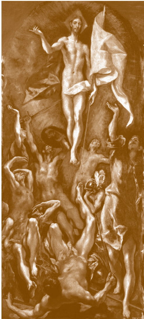
Resurrección . Doménicos Theotocópoulos, “el Greco”. 1596-1600. Museo del Prado, Madrid

Juan subrayó con caridad y claridad el principal mandamiento que Jesús dio a sus apóstoles en la Última Cena: «Este es mi precepto, que os améis los unos a los otros como yo os he amado» (Jn 15,12). Jesús, después de asegurar que Él es «el camino, la verdad y la vida» (Jn 14,6) y que «ha venido al mundo para dar testimonio de la verdad» (Jn 18,37), pide para sus discípulos en su oración al Padre que los santifique en la verdad: «Santifícalos en la verdad, pues tu palabra es verdad» (Jn 17,17). San Juan proclamó en su primera epístola que «Dios nos dio la inteligencia para que conozcamos al verdadero Dios, que es Jesucristo» (1 Jn 5,20) y que Dios es luz y amor , recalcando que el amor de Dios se manifestó en que envió al mundo a su Hijo unigénito por amor a los hombres. El evangelista no se anduvo con chiquitas al decirnos sin remilgos cómo tenemos que amar: «No amemos de palabra ni de lengua, sino de obra y de verdad» (1 Jn 3,18).