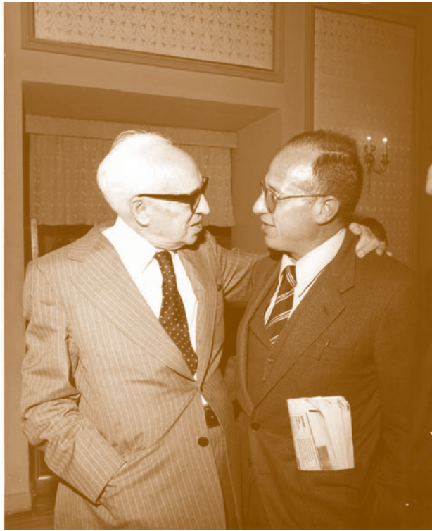
Severo Ochoa. Madrid (1980)

¿Adónde va, cuando se va escondiendo, y el aire, el cielo queda ardiendo, oliendo a olor, ardor, amor de rosa hurtada?