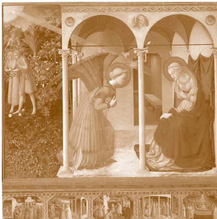
La Anunciación. Beato Angélico. siglo XV. Museo del Prado, Madrid

Dicen que decía Sócrates en los tiempos de la Grecia clásica, varios siglos antes de que fueran concebidos María y su Hijo, que las cosas importantes hay que repetir las muchas veces, y si son muy importantes con las mismas palabras a ser posible. Yo por mi parte añadiría de mi propia cosecha que es importante separar lo principal de lo secundario y que es muy importante distinguir entre saber , que es certeza, y creer , que es confianza y esperanza, hasta llegar incluso a ser ilimitadas. Creer procede del latín ( credere, cor dare ) y significa dar el corazón, y solo se puede entregar el corazón a quien bien nos quiere y de quien de verdad nos podemos fiar. El corazón cree con fe y ánimo lo que es bueno, razonable y fiable, y la mente sabe con conocimiento y convicción lo que sin género de dudas es verdad. En mis tiempos