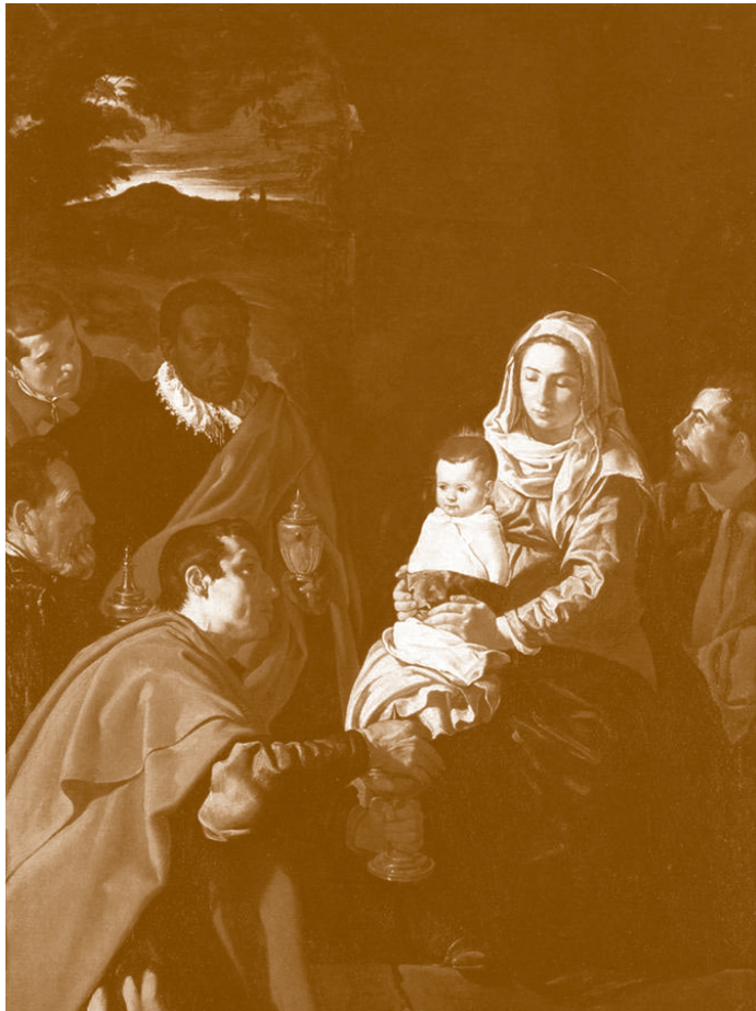
La Adoración de los Magos. Diego de Silva y Velázquez. 1619. Museo del Prado, Madrid

Según la tradición judeocristiana, María es de la tribu de Judá y del linaje de David. Juan evangelista fue quien más y mejor supo cuidar y venerar a la Madre de Jesucristo, llevándosela a su casa después de la muerte, Resurrección y Ascensión de su Hijo. El Corán , Libro Sagrado del Islam, venera también a la Inmaculada Virgen María «como la escogida por Dios entre las mujeres del mundo». Esta visión de María, modelo de perfección también para los musulmanes, debe ser valorada muy positivamente por hebreos y cristianos como puente de encuentro y comprensión entre las tres religiones de la Biblia , mayoritarias en el mundo de hoy. De Abraham descienden los judíos y cristianos por su mujer Sara y su hijo Isaac, y los árabes por su esclava Agar y su hijo Ismael. Unos y otros debemos perdonar nuestras pasadas ofensas, conocernos mejor, reconocer lo que tenemos en común, respetar las diferencias y tratar de resolverlas sin apasionamiento y en aras del bien y la verdad ¡Siempre la verdad y el bien por encima de particularismos enaltecidos! En su visita a la mezquita de Damasco el año 2001, el Papa Juan Pablo II entregó como obsequio al Gran Mufti una imagen de la Virgen venerada por el Corán.