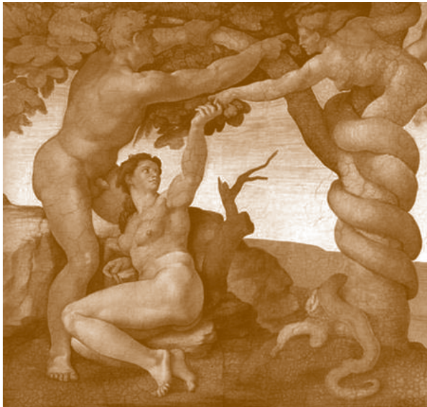
Pecado original y expulsión del Paraíso. Miguel Ángel. 1508-1510. Capilla Sixtina, Roma