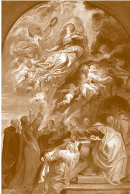
La Asunción de María. Pedro Pablo Rubens. 1620-22. Mauritshuis, La Haya

Felipe Neri, florentino conocido por su caridad y devoción a la Virgen y fundador de la Congregación del Oratorio (filipenses), se convirtió en el apóstol de Roma. San Pío V, dominico y reformador de la Iglesia, renovó las disposiciones de Sixto IV y publicó la constitución Super speculum Domini , en cuya introducción recoge el escándalo producido por las controversias entre partidarios y contrarios a la doctrina de la Inmaculada Concepción. Años más tarde, en la bula Ex omnibus afflictionibus condenó a quienes afirman que la bienaventurada Virgen María tuvo pecado original y que nadie, fuera de Cristo, está sin pecado original. Los hombres, incluso los más capaces y de más clara inteligencia y recta conciencia, son fiables, pero también falibles.