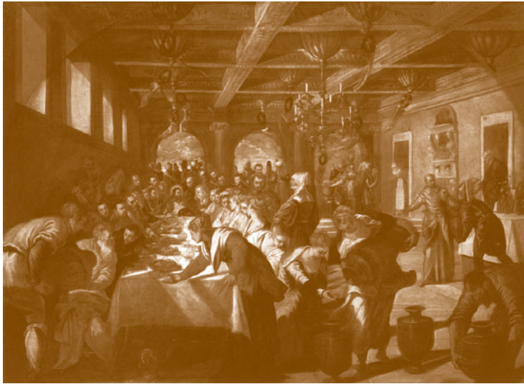
Las bodas de Caná . Jacobo Comin, “el Tintoretto”. 1561. Santa Maria della Salute, Venecia

Jesucristo pronunció estas palabras —confirmadas por el apóstol Pablo en su primera carta a los corintios (1Co 11,23-25)— con plena conciencia de que iba a morir crucificado y resucitaría al tercer día para quedarse siempre con nosotros bajo estas especies sacramentales. Mateo, Marcos y Lucas refieren además en sus evangelios la predicción por Jesucristo de su muerte y Resurrección , repitiendo con detalle sus palabras nada menos que tres veces en tres ocasiones distintas: (Mt 16,21; 17,22-23; 20,17-19), (Mc 8,31; 9,30; 10,32-34), (Lc 9,22; 9,44; 18,31-33), y la Iglesia ha aseverado desde el principio que la Eucaristía es el sacramento de la fe cristiana. Al final de la conmemoración del misterio de la Eucaristía, los cristianos entonamos con gozo y esperanza: “Anunciamos tu muerte. Proclamamos tu resurrección”. Son muchas en el mundo las ciudades, entre ellas Sevilla, que exteriorizan este misterio inenarrable festejándolo con gran solemnidad y devoción el día del Corpus Christi .