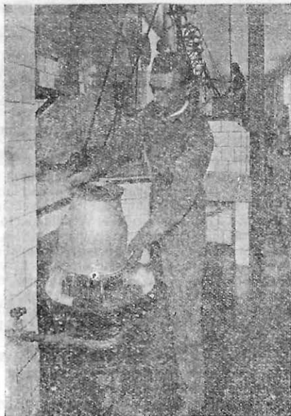
Esterilización de cántaros y vasijas por vapor

Leche declorurada. - Edemas, Albuminaria, Eclampsia Nefritis, Úlcera gástrica, etc.