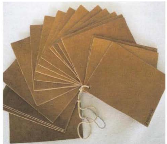
Muestras de los cueros sometidas a la evaluación subjetiva.

Los evaluadores recibieron las muestras debidamente identificadas, junto a un cuestionario con los parámetros subjetivos, acompañado de un glosario con la descripción de cada variable y sus categorías, para descartar eventuales errores de interpretación.