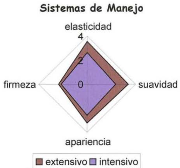
Figura 1: Gráfica radial del perfil sensorial según el sistema de manejo

cativas entre las variables analizadas, presentando valores de densidad similares a los encontrados por Holst (1990) con razas australianas y Costa, R.G. et al. (2005) para animales del mismo grupo de edad y peso. Las medias se pueden observar en la tabla 1.