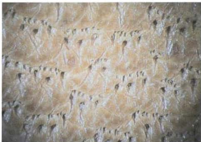
Apariencia de la superficie del cuero caprino de raza Blanca Andaluza. (Autor: Sarah Rey). Obsérvese el agrupamiento característico de los folículos primarios (A), rodeados de múltiples folículos secundarios (B).

lorizada asociándose a un producto diferenciado, vinculado a la cría de nuestras razas locales y potenciándose así nuestros recursos naturales.