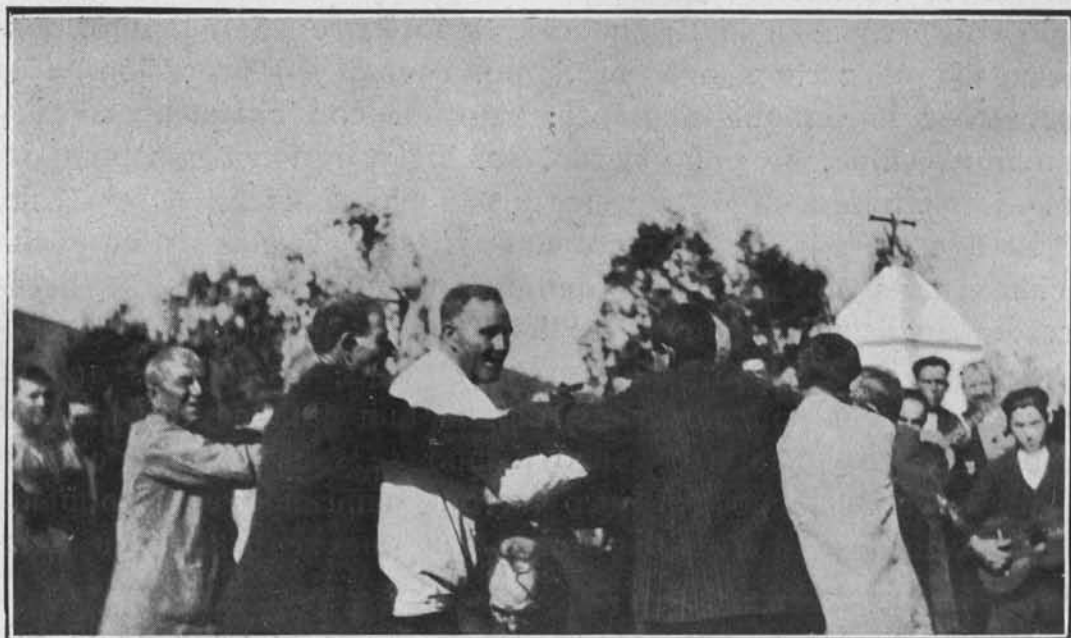
El degüello del Patatú