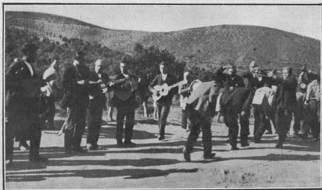
La cadena, figura fundamental del Patatú