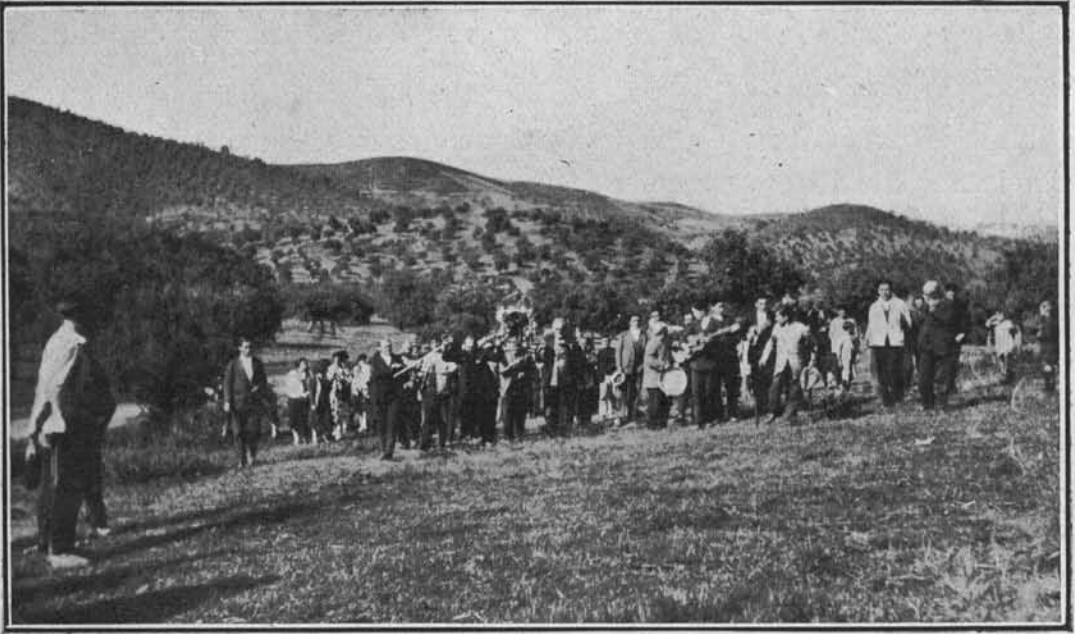
El retorno a la Ermita, última cadena del Patatú

Pero de pronto la danza se interrumpe; el hermano mayor, que figura a la cabeza de la cadena, queda aprisionado entre las demás espadas que se cruzan alrededor de su cuello; la danza sigue,