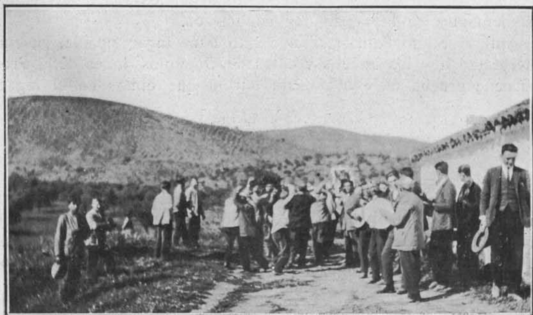
Conjunto de la danza