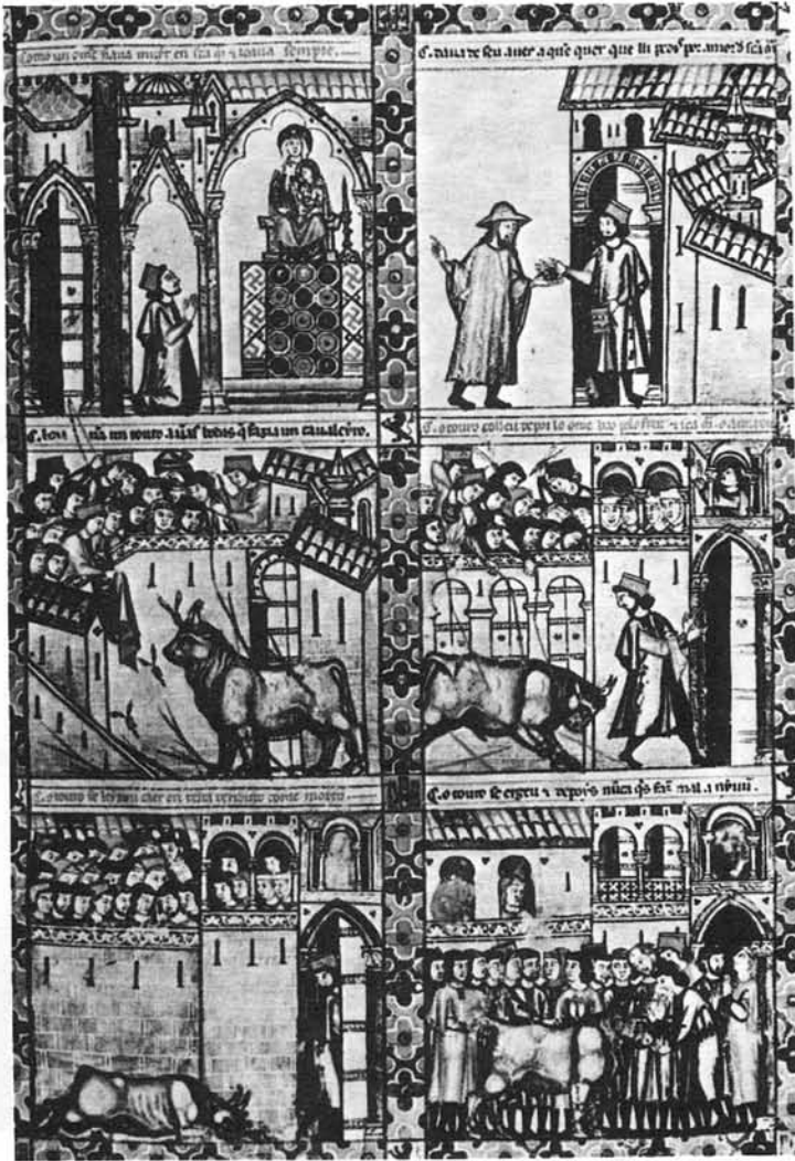
Fig. 1. Cantiga CXLIV. Suceso acaecido en Plasencia con motivo de una corrida nupcial.