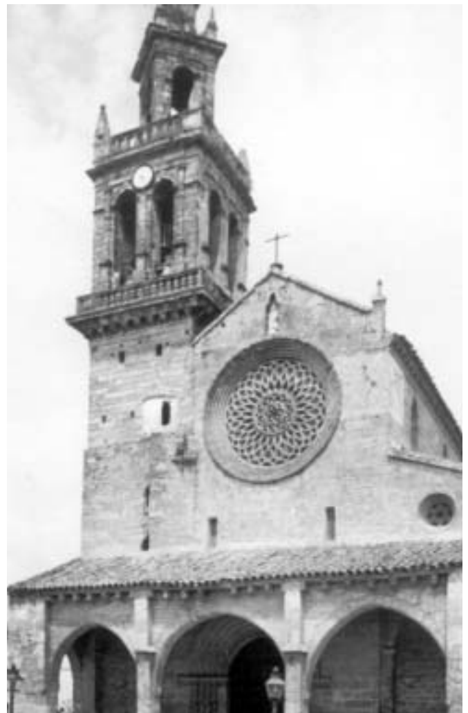
Fig. 9. San Lorenzo

Entre ellas están: Sta. Marina (aspecto de fortaleza), S. Hipólito, (fue fundada en conmemoración de la batalla del Salado. Sepulcros de Fernando IV y Alfonso XI, S. Lorenzo (Fig. 9) (destacan las pinturas murales del s. XIV en su ábside interior, pórtico del s. XIV y rosetón), S. Pedro (antigua catedral mozárabe), S. Pablo (fundada en 1241; su portada principal de 1705 es de estilo churrigueresco con co-