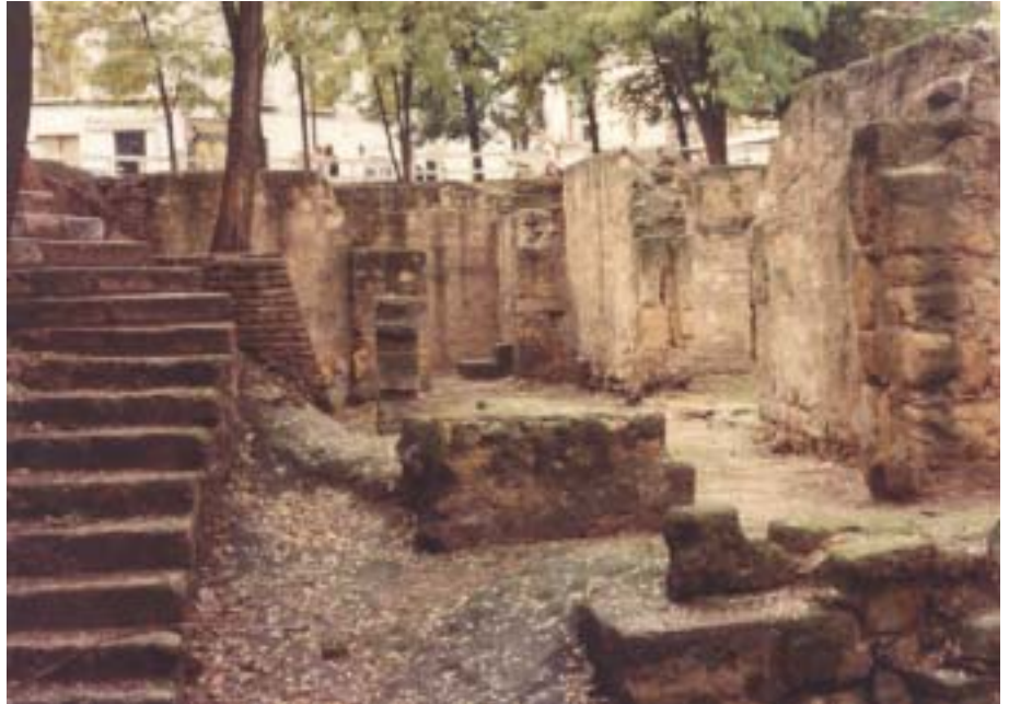
Fig. 8. Baños árabes