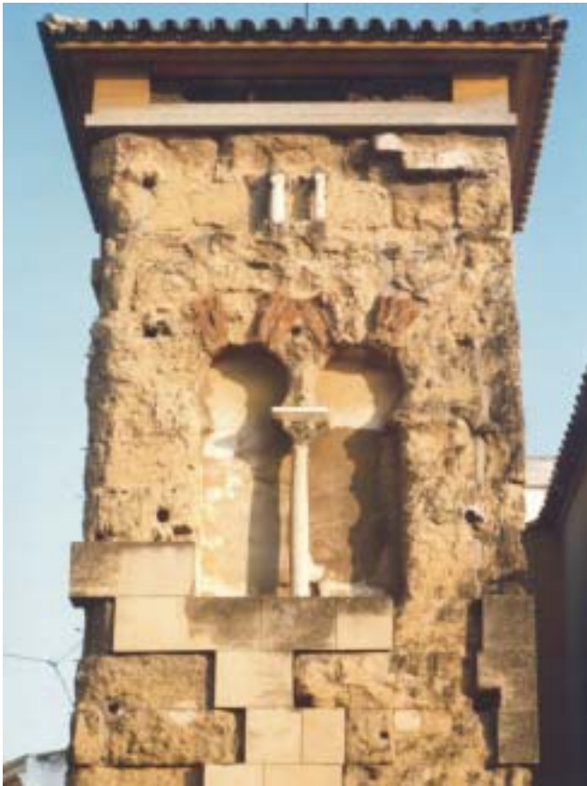
Fig. 6. Torre de S. Juan