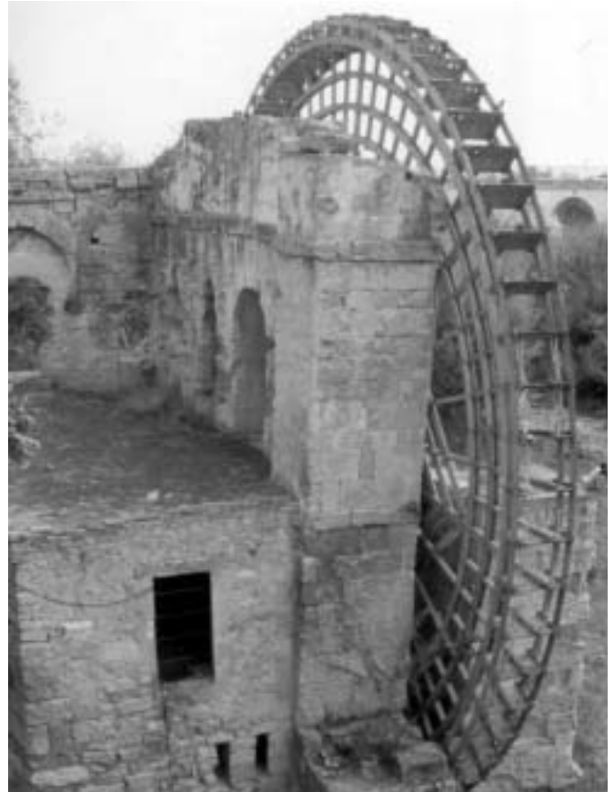
Fig. 7. Albolafia

Templo (s. I) Se conservan sus columnas (al lado del actual Ayuntamiento).