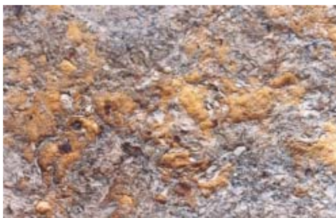
Fig. 2. Biomicrita