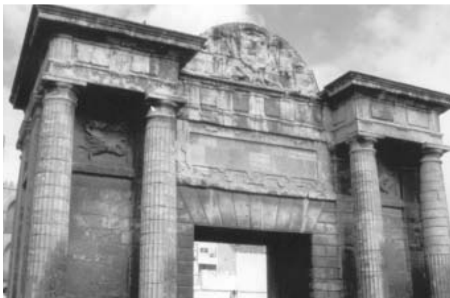
Fig. 10. Puerta del Puente

Podemos concluir que en orden a su utilización son las biocalcarenitas las más empleadas en todas las épocas y monumentos debido a la proximidad de sus yacimientos y la facilidad para su extracción. Estos yacimientos se alinean