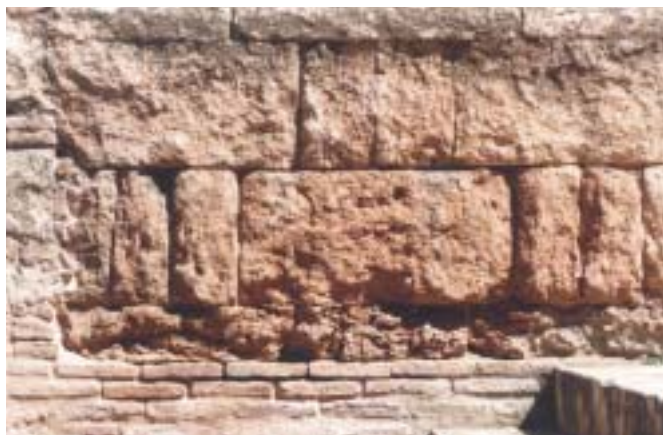
Fig. 1. Biocalcarenita conglomerática.