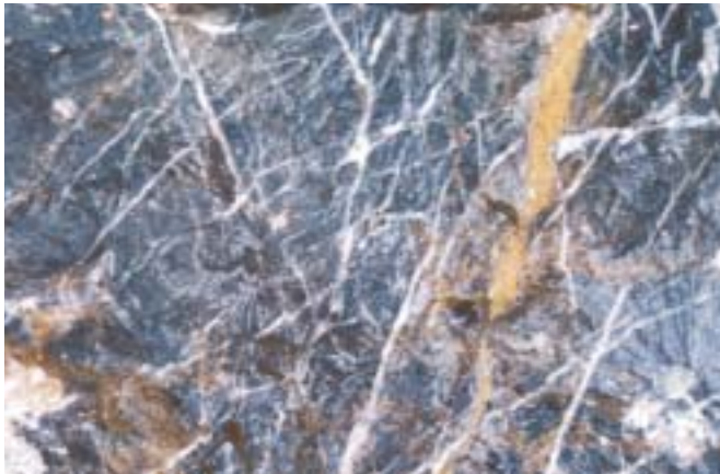
Fig. 4. Caliza veteadada gris