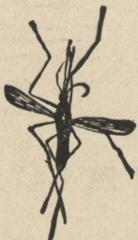
ANOFELE. Mosquito que propaga la fiebre palúdica.

Previene el paludismo y le cura en todas sus formas