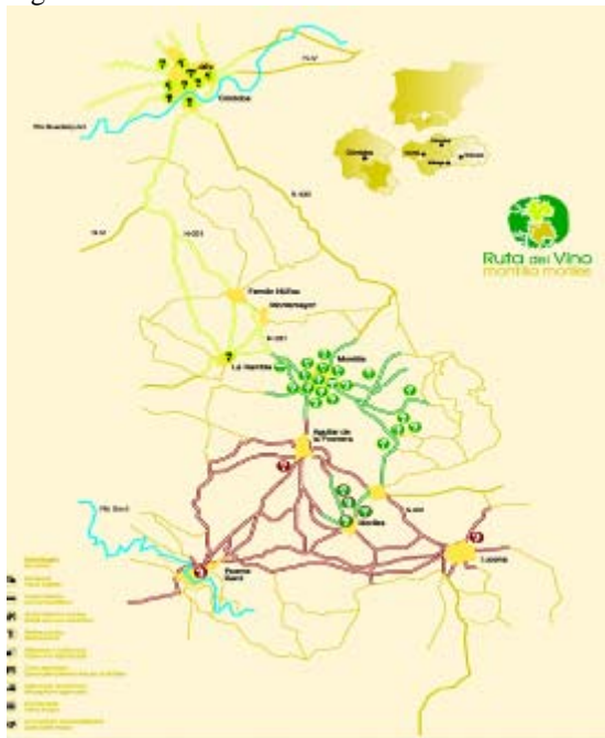
Figura 2. Ruta del Vino "Montilla-Moriles"

La Ruta del Vino Montilla-Moriles 1 nace a principios de 2001, en el marco de los compromisos adquiridos por el Ayuntamiento de Montilla, como ciudad del vino, con ACEVIN. En abril de 2001 se constituye la Asociación para la Promoción del Turismo del Vino (AVINTUR), ente gestor que se ocupa de gestionar la Ruta del Vino Montilla-Moriles. Como anteriormente hemos señalado es imprescindible la creación de un ente gestor para el desarrollo de una ruta enológica ya que la creación de estas alianzas estratégicas entre diferentes actores es uno de los elementos clave para el éxito de cualquier ruta enológica (Telfer, 2001). En este momento, forman parte de la ruta 39 entes públicos y privados, destacando especialmente bodegas y alojamientos rurales. La ruta discurre por el sur de la provincia de Córdoba y atraviesa nueve municipios (Aguilar de la Frontera, Córdoba, Fernán Núñez, La Rambla, Lucena, Montilla, Montemayor, Moriles y Puente Genil). En la Figura 2 se recoge el croquis de los itinerarios de la Ruta del Vino elaborado por el Patronato Provincial de Turismo de Córdoba y la empresa Antar.