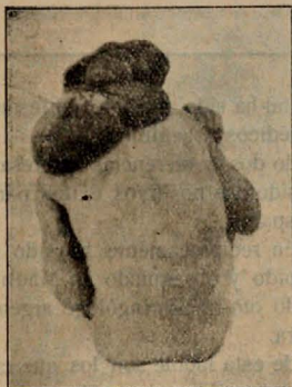
El mismo visto por su cara dorsal

El puerperio ha sido normal, lactando el