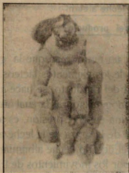
Feto mónico en el que se observan los detalles que apuntamos.

Cuando llego a la casa encuentro la par-