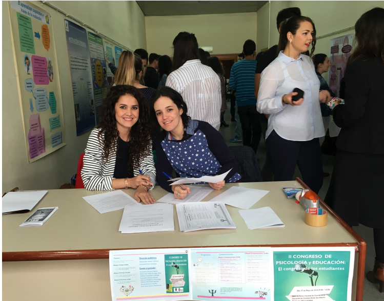
3. Imagen de una sesión de póster del “II Congreso de Psicología y Educación: El Congreso de los Estudiantes”.