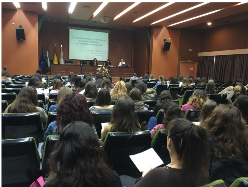
2. Imagen de la inauguración del “II Congreso de Psicología y Educación: El Congreso de los Estudiantes”.

10. Al final se les proporciona un diploma de asistencia y se representa a los autores, además de un reconocimiento a los ganadores de los premios.