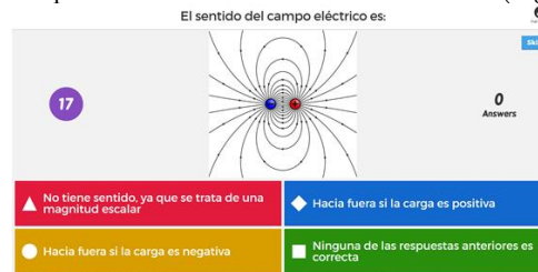
1. Ejemplo de cuestión con cuatro posibles respuestas.

A través de la plataforma web Kahoot , el profesor puede crear cuestionarios, discusiones o encuestas que pueden contar con imágenes o vídeos aclaratorios que complementen el contenido académico (Figura 1).