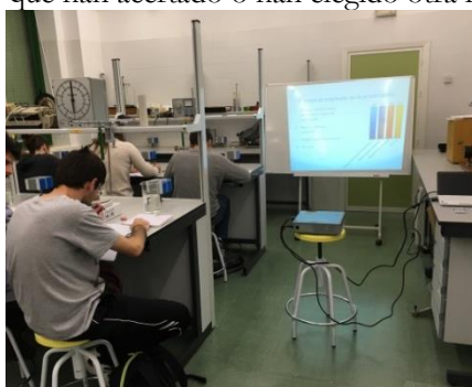
3. Ejemplo de sesión práctica en laboratorio usando clickers .

Al comienzo de la sesión práctica, el profesor plantea un cuestionario inicial, usando el software Turning Point . En la Figura 3 se ilustra una sesión práctica con el sistema expuesto. Los alumnos disponen de un tiempo límite para emitir su respuesta con los clickers a la pregunta presenta en cada diapositiva. Alcanzado el tiempo límite, se muestra en la pantalla, la respuesta correcta y el porcentaje de alumnos que han acertado o han elegido otra respuesta no correcta.