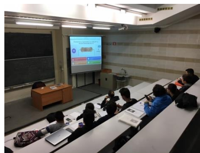
2. Estudiantes usando Kahoot durante las clases prácticas.

Como experiencia, en la asignatura Fundamentos Físicos en la Ingeniería II del Grado en Ingeniería Electrónica de la Universidad de Córdoba, se puso en práctica este sistema con objeto de repasar los contenidos explicados por el profesor (Figura 2).