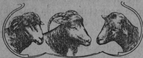
CARBUNCIDA - PANZANO