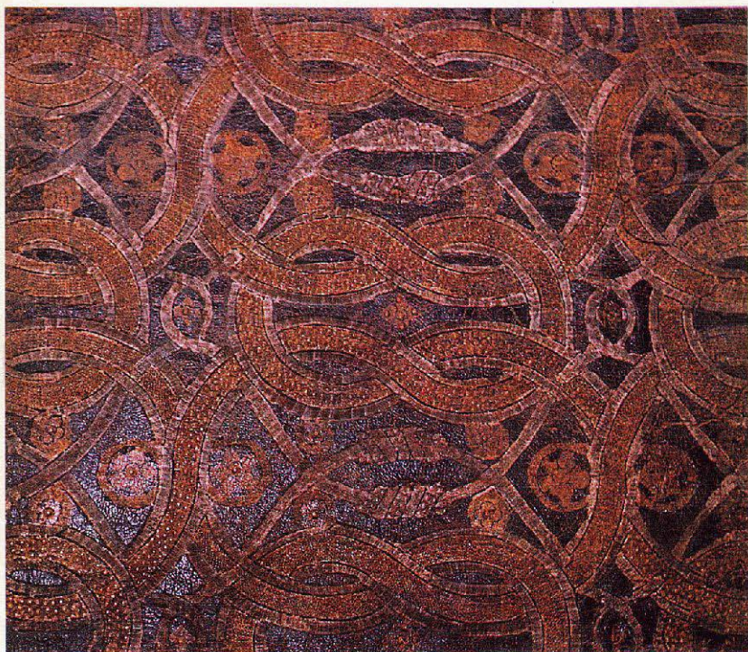
Guadamecí siglo XVI (Palacio Museo de Viana)