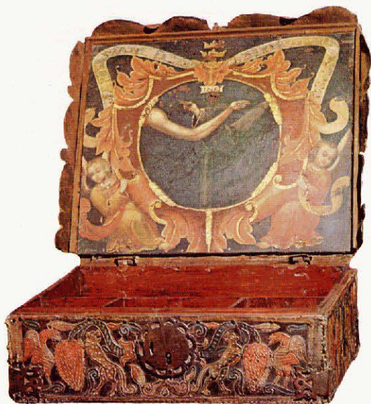
Arqueta estilo mudéjar siglo XVI. Excmo. Ayuntamiento de Córdoba. Depósito E. Artes Aplicadas.