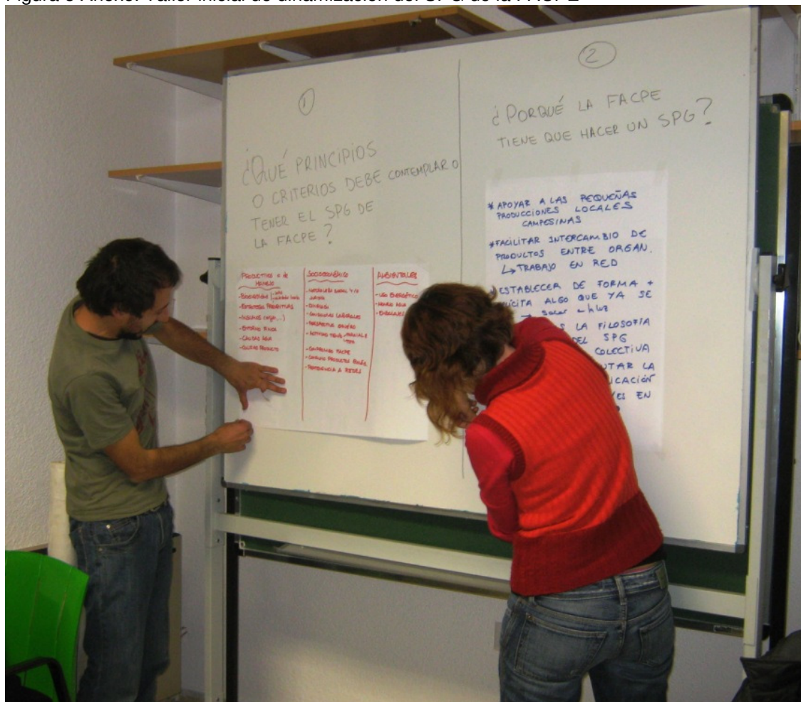
Figura 5 Anexo. Taller inicial de dinamización del SPG de la FACPE

Almocafré que señaló el no tener claro lo del SPG de la FACPE, participó activamente y contribuyó al proceso de alcanzar acuerdos colectivos. Lo cual me pareció muy bueno.