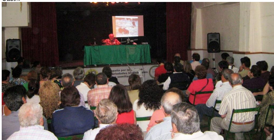
Figura 3 Anexo. Charla magistral Feria Andaluza de la Biodiversidad cultivada desarrollada en Castril