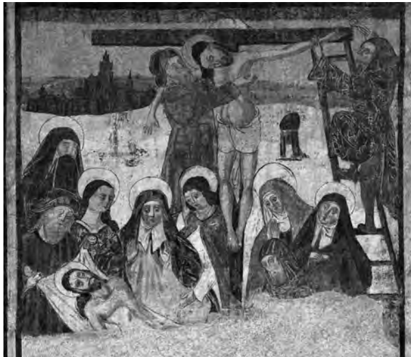
Figura 3. Frescos que han aparecido en el interior de la Iglesia de San Juan. Obsérvese la cruz griega en forma de T (E.C., 2011).