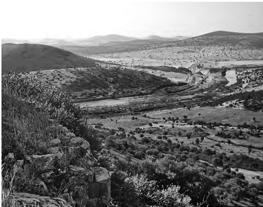
Figura 7. Perspectiva desde el emplazamiento de Aznahrón. En primer término, a la izquierda, sillares correspondientes al muro perimetral del castillo (E. C., 1978).

señoríos. 81 Su emplazamiento, a cierta altura, y los accesos un tanto complejos convertían a Aznahrón en un lugar tal vez un tanto incómodo. No obstante, merecía la pena restaurar la población allí, y está claro que se hizo lo posible por conseguirlo. Pero todo parece indicar que no pudo lograrse. Por ejemplo, apenas he encontrado menciones de Aznahrón con el nombre de «villa». En la documentación disponible suele aparecer alguna vez con el nombre de «puebla», pero el término más frecuente es el de «castillo». 82 En referencias posteriores, ya en el reinado de Enrique II, en 1370, tras la Peste Negra y la guerra civil, aunque se cita con su nombre (frecuentemente con una grafía diferente de la habitual) 83 ni siquiera se menciona su condición