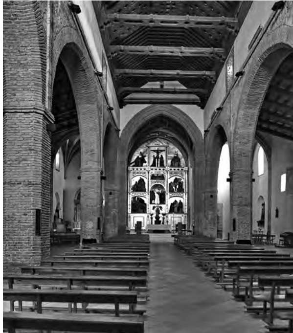
Figura 2. Interior de la Iglesia de San Juan (E.C., 2011).