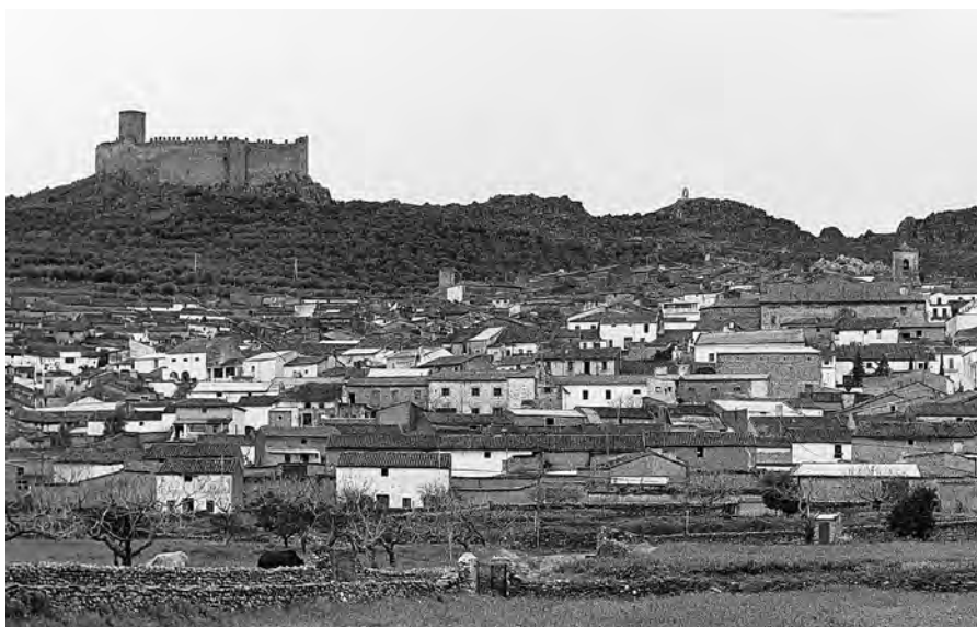
Figura 4. Puebla de Alcocer