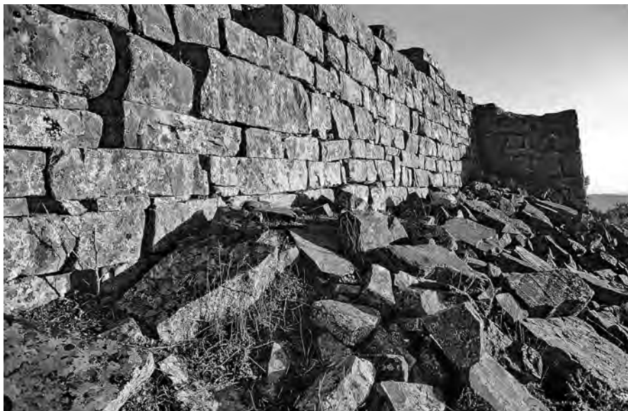
Figura 8. Ruinas del castillo de Vioque.