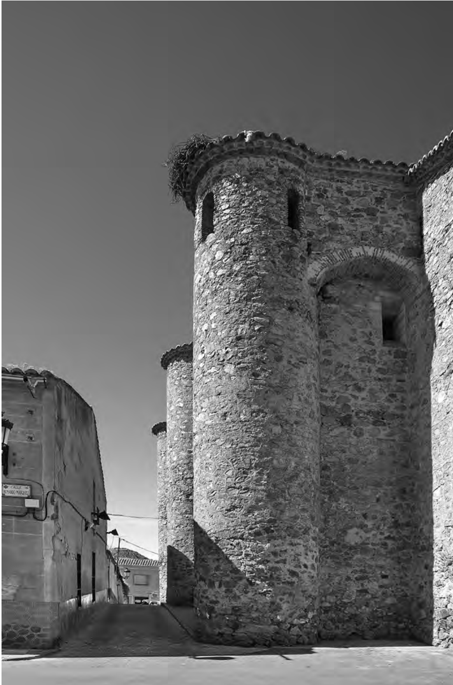
Figura 1. Torres del antiguo castillo de Chillón (E. C., 2011).