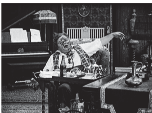
▪ Fig. 5. Buster Keaton y los "atentados" contra el ojo. Fotogramas de Moonshine (1918).