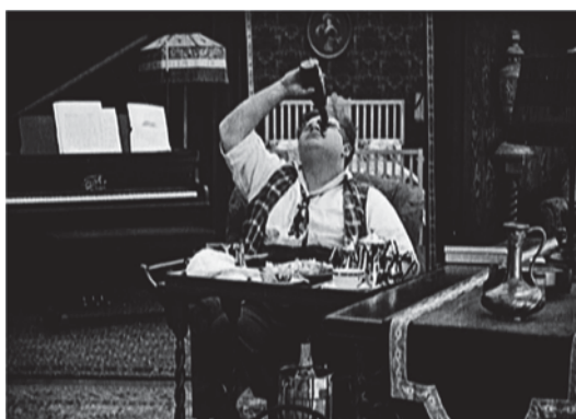
▪ Fig. 4. El suicidio fingido de Fatty en Moonshine (1918).