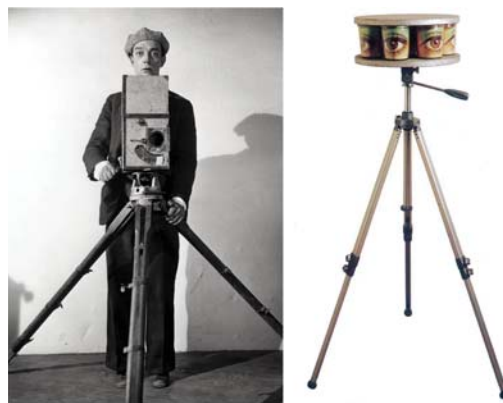
Fig. 2. Keaton en The Cameraman (1929) (izq.). La mirada del operador es la mirada de la cámara, casi una equivalencia de la muy vertoviana Caméra qui regarde (1966) de Marcel Broodthaers (dcha.).

las de uno y otro compartan recursos muy semejantes; caso de sobreimpresiones, falsos raccords repetitivos, y trucajes, que se hacen evidentes si se comparan algunos de sus films (dedicados, además, a la misma temática: el cine), como El hombre de la cámara (1929), de Vertov, y The cameraman (1928) y Sherlock Jr. ( El moderno Sherlock Holmes , 1924), de Keaton 76 (Fig. 2).