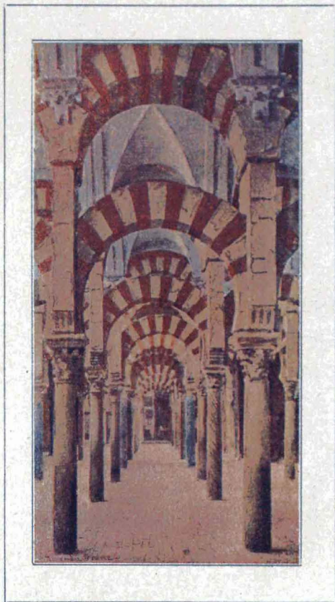
CÓRDOBA. INTERIOR DE LA MEZQUITA