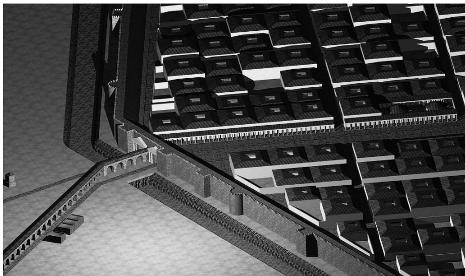
FIG. 6: Reconstrucción de la entrada del Aqua Augusta "Vetus" a principios del s. I d. C.

Tras las guerras civiles, la ciudad debió quedar arrasada, comenzando las tareas de desescombro y reconstrucción. No obstante lo acaecido, la ciudad no perdió preponderancia y recibió un considerable respaldo al acoger dos deductiones y recibir el estatuto colonial (VENTURA, 2008, e.p.). Estos hechos suponen una transformación radical de la ciudad que recibe las infraestructuras y la monumentalidad propias una capital provincial.