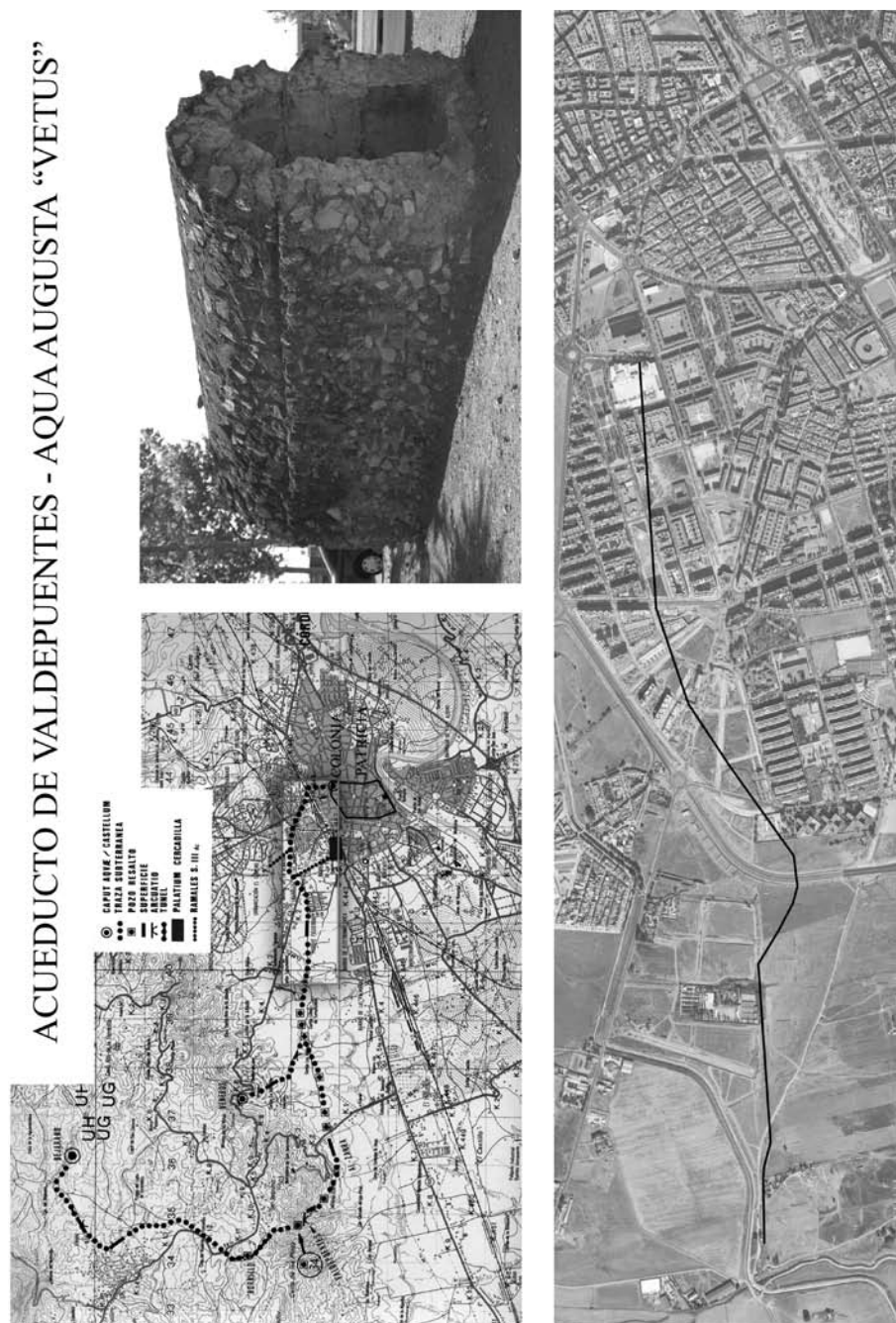
FIG. 1: Arriba (de izquierda a derecha): Trazado del acueducto de Valdepuentes (a partir de Ventura: 1996). Specus conservado en la Glorieta de Sta. Isabel. Abajo: Último trazado del acueducto conocido antes de entrar en la ciudad.