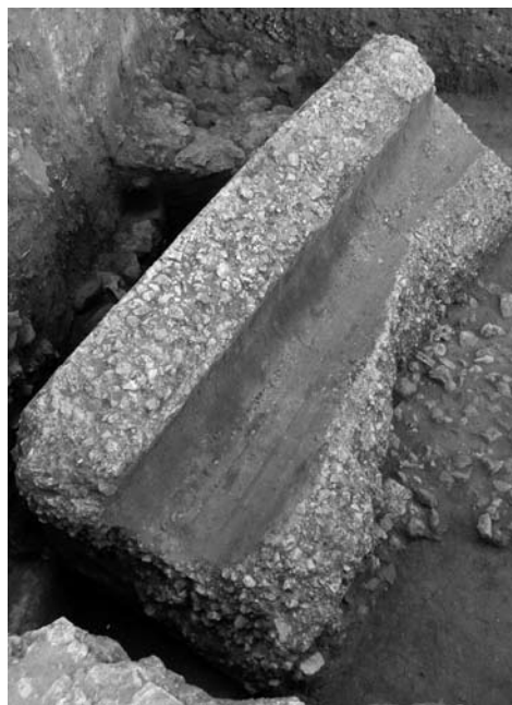
FIG. 7: Cubierta del acueducto aparecida en la Avda. Gran Capitán, 5.

Cuanto se ha exhumado hasta el momento adscribible al acueducto –de un inusitado interés por cuanto constituyen los primeros restos materiales que hemos podido examinar de visu – son varios bloques de caementicium de considerables dimensiones (fragmentos de 1,4 m. de anchura, correspondiendo así con la de los pilares, y hasta 4 m. de longitud), reutilizados tanto en la cimentación como en el alzado de viviendas de época musulmana ( Fig. 7 ) 30 . Estos elementos pertenecen a la cubierta de la canalización, dado que presentan al interior una bóveda semicircular de 60 cm. de diámetro, así como las huellas del tablero de la cimbra, coincidentes con las del acueducto de Valdepuentes.