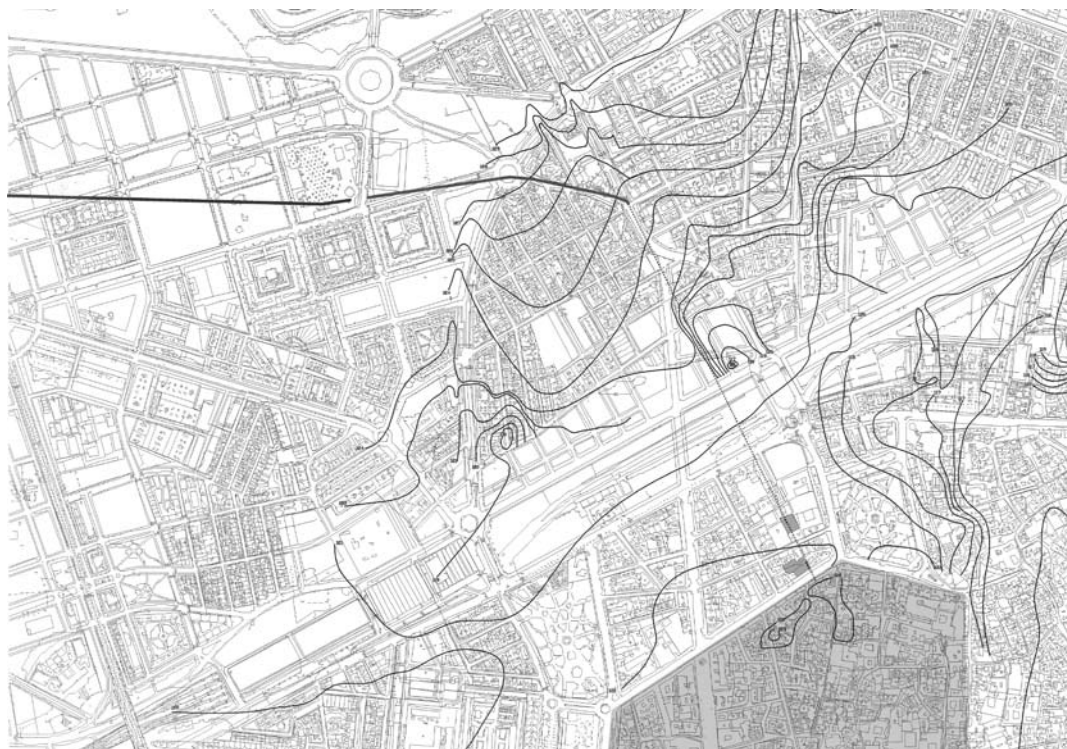
FIG. 3: Propuesta de Trazado del Aqua Augusta "Vetus" a su entrada a Colonia Patricia (Curvas de nivel del plano de Dionisio Casañal, 1884).

ma bastante "confuso" y generalizado sobre cómo debió de evolucionar este sector suburbano. No obstante, la excavación de dos solares en la década de los 80, que jalonan el "Camino del Pretorio" proporcionan indicios afines a nuestra idea.