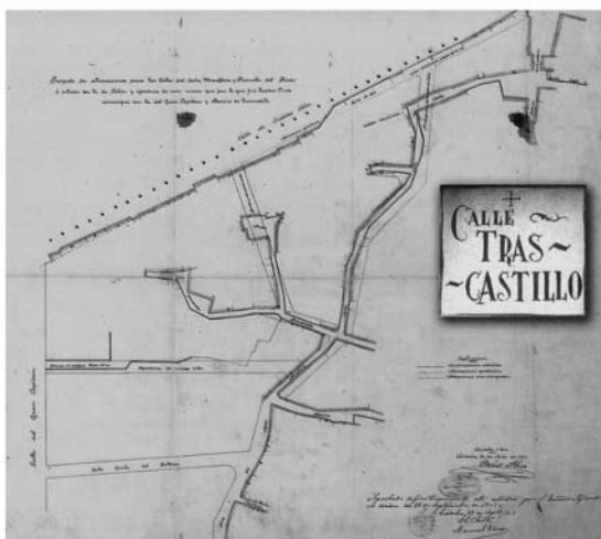
FIG. 4: Arriba: Entrada del Acueducto de Minturnae (RICHMOND: 1933). Abajo: Proyecto de alineación de las calles Caño y Plazuela del Prior en el Barrio de "Trascastillo" (P. ALONSO, 1903).

y s.; HIDALGO Y VENTURA, 2001, 250 y s.), aunque sin relación aparente.