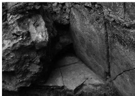
FIG. 5: Fistula Plumbea aparecida bajo las cimentaciones del Teatro romano de Córdoba.

26 | Puesto que antiguamente la calle Caño comunicaba directamente con Osario, quizá el desagüe misterioso recogido por Ramírez de Arellano pudiera ser la estructura abovedada de sillares encontrada en la excavación de Ronda de los Tejares 6, con dirección NW/SE, que parecía dirigirse a la Puerta. Atribuida a época Musulmana por los materiales que la colmataban por cortar estructuras romanas. No se sabe si alguna vez fue utilizada para conducir agua potable (IBÁÑEZ, 1990) (Fig. 2).