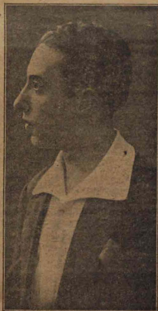
El notable pintor LEÓN ASTRUC

que recordamos con íntima satisfacción en estos días en que se muestra a la curiosidad pública un cartel de feria, que está siendo muy discutido.