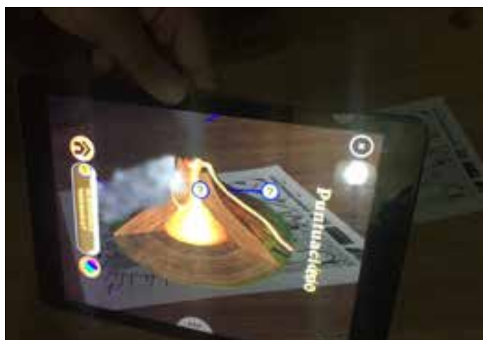
Imagen 4. Volcán en erupción.

Para evaluar los logros de los estudiantes se empleara una rúbrica diseñada ad hoc, en ella se valorará de 1 a 5, donde uno es no conseguido en su totalidad y 5 conseguido totalmente, los objetivos didácticos señalados en la tabla 1,