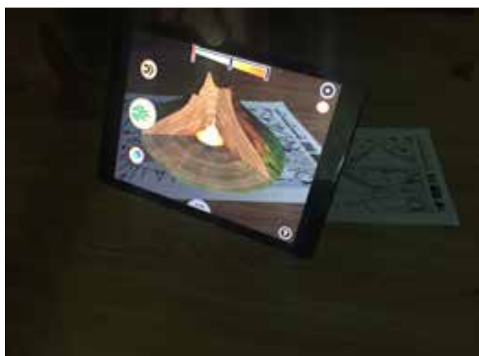
Imagen 3. Interior del volcán.

Una vez coloreada el marcador por parte de cada alumno se procederá a proyectar con la Tablet para que ellos vean las semejanzas y diferencias entre su trabajo y la imagen. Posteriormente se procederá a enseñar el corte lateral del volcán para que puedan comprobar el contenido que el docente les está explicando, relativo a las partes del mismo, (ver imagen 3)..