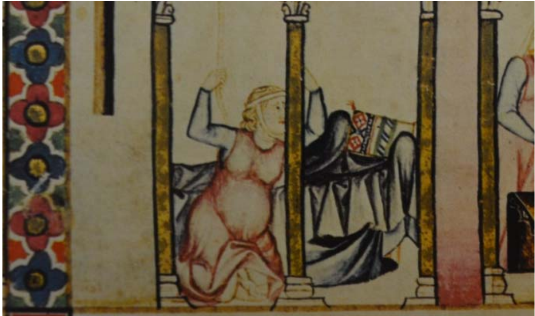
Figura 1. Miniatura de Las Cantigas de Santa María (Cantiga 17). Siglo XIII. Imagen del autor.