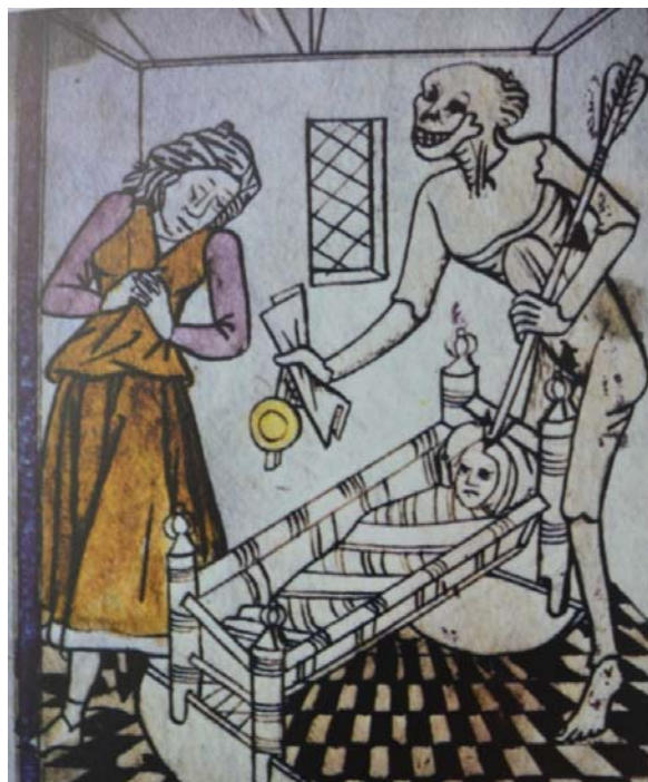
Figura 7. Danza de la muerte donde se observa que la Muerte se va a llevar al pequeño que está en la cuna.

No poseemos muchos datos acerca de los funerales infantiles de la época. Entre los grupos privilegiados, el féretro solía estar rodeado de muchas velas y antorchas, siendo cubierto por una gran tela, generalmente de color negro, como sucedió en el funeral de José, uno de los hijos de Felipe el Bueno, fallecido en