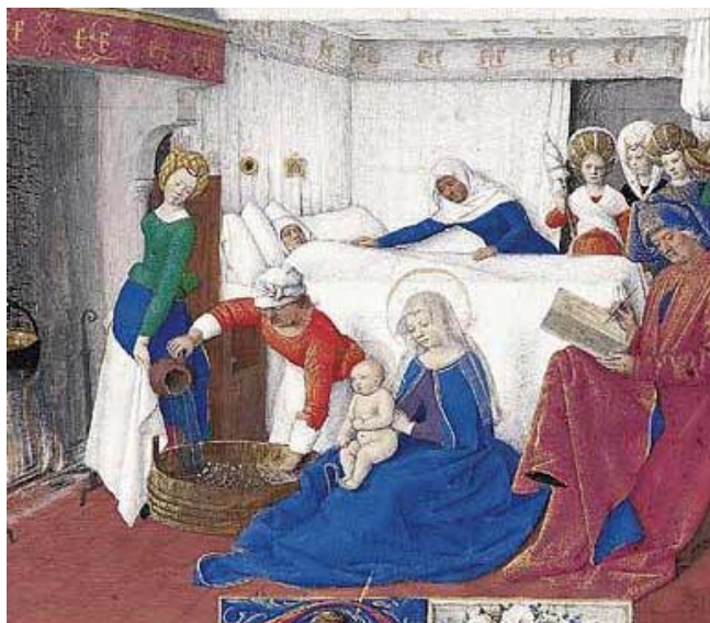
Figura 4. Detalle del primer baño de un recién nacido. Obra de Jean Fouquet (hacia 1452-1460).

Tras el primer baño, la matrona movía las extremidades del recién nacido para comprobar que el pequeño no sufría ningún mal en las mismas. Se trataba de gimnasia neonatal, un examen médico que, como es sabido, aún hoy se hace 52 . Además, el niño debía llorar para demostrar que estaba vivo. Si no lo hacía, la matrona debía comenzar a reanimarlo 53 .