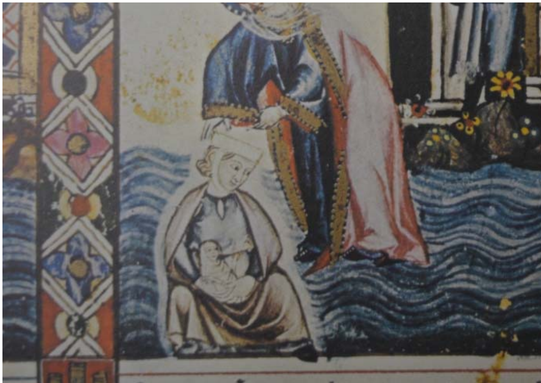
Figura 2. Miniatura de Las Cantigas de Santa María (Cantiga 86). Siglo XIII. Imagen del autor.