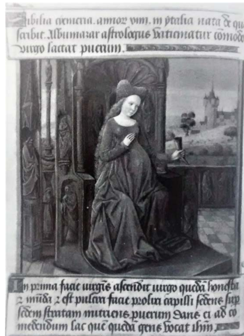
Figura 5. Representación de un cuerno de amamantar. FUENTE: Alexandre-Bidon, Danièle; Closson, Monique, Op. cit. , 2008, p. 198.