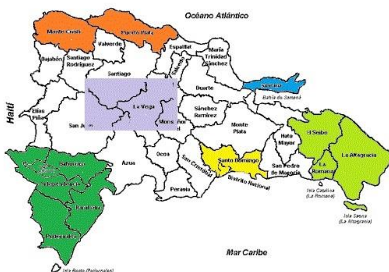
Figura 2: Mapa de polos turísticos de República Dominicana.

Las provincias en verde claro son, como ya se ha soslayado, las provincias con mayor densidad de resorts, ahí se encuentran regiones turísticas como Punta Cana o Puerto Plata, así como los resorts de gran lujo en La Romana. Además, como complemento se sitúan al sur de la provincia de La Altagracia, la Isla Saona, la cual es un atractivo innegable por su conservación como isla virgen.