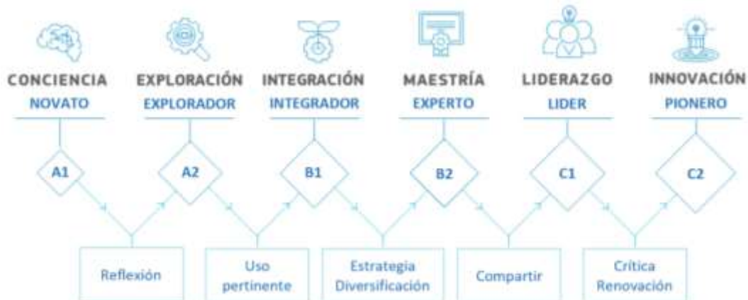
Figura 3. Niveles y progresión competencial del Marco Europeo de Competencia Digital del Profesorado «DigCompEdu». Fuente: elaboración propia.

Teniendo en cuenta estas competencias, se establecen seis niveles progresivos de manejo (Figura 3). De esta manera, se identifica el nivel de competencia digital de un docente, conceptualizándose como sigue los distintos niveles progresivos de desarrollo y autonomía.