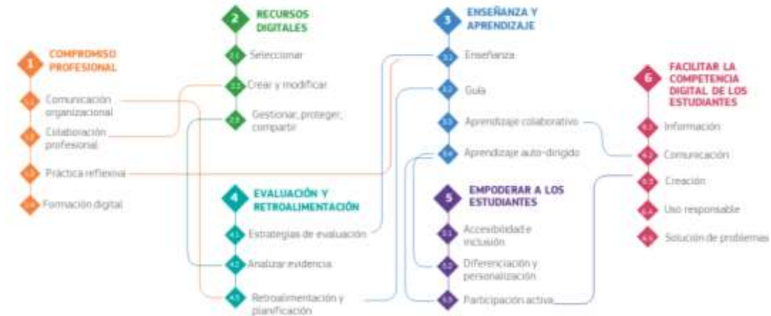
Figura 2. Áreas competenciales, competencias y relaciones competenciales del Marco Europeo de Competencia Digital del Profesorado «DigCompEdu».

Teniendo en cuenta estas competencias, se establecen seis niveles progresivos de manejo (Figura 3). De esta manera, se identifica el nivel de competencia digital de un docente, conceptualizándose como sigue los distintos niveles progresivos de desarrollo y autonomía.