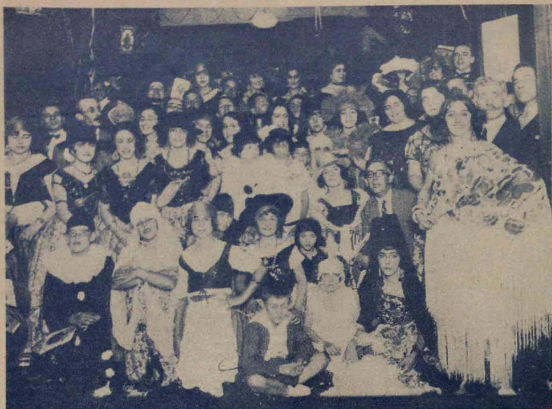
Lucido aspecto de uno de los bailes