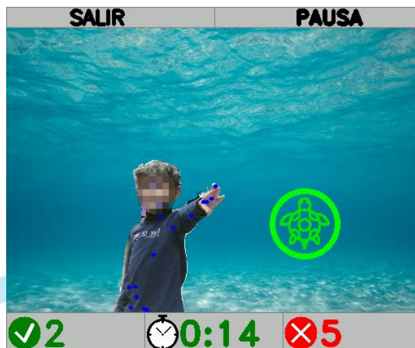
Pantalla que potencia ciertas habilidades en niños con trastornos en el desarrollo

Por su parte, la motricidad fina está relacionada con la adquisición de la pinza digital, así como de una mejor coordinación óculo manual, unido al control voluntario de los movimientos finos, pequeños y precisos. En el caso de niños con trastornos en el desarrollo o con riesgo de pa-