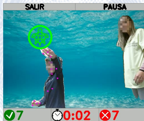
Interfaz para desarrollar la motricidad fina en pequeños

En estos momentos se ha ideado un sistema de apoyo y evaluación de la motricidad fina basado en Leap Motion (MotriMotion), que procede de un TFG presentado en julio, que pretende que el niño esté inmerso en una realidad cercana a sus intereses pero que al mismo tiempo no lo aisle y lo encamine hacia el objetivo que se pretende con la terapia propuesta.