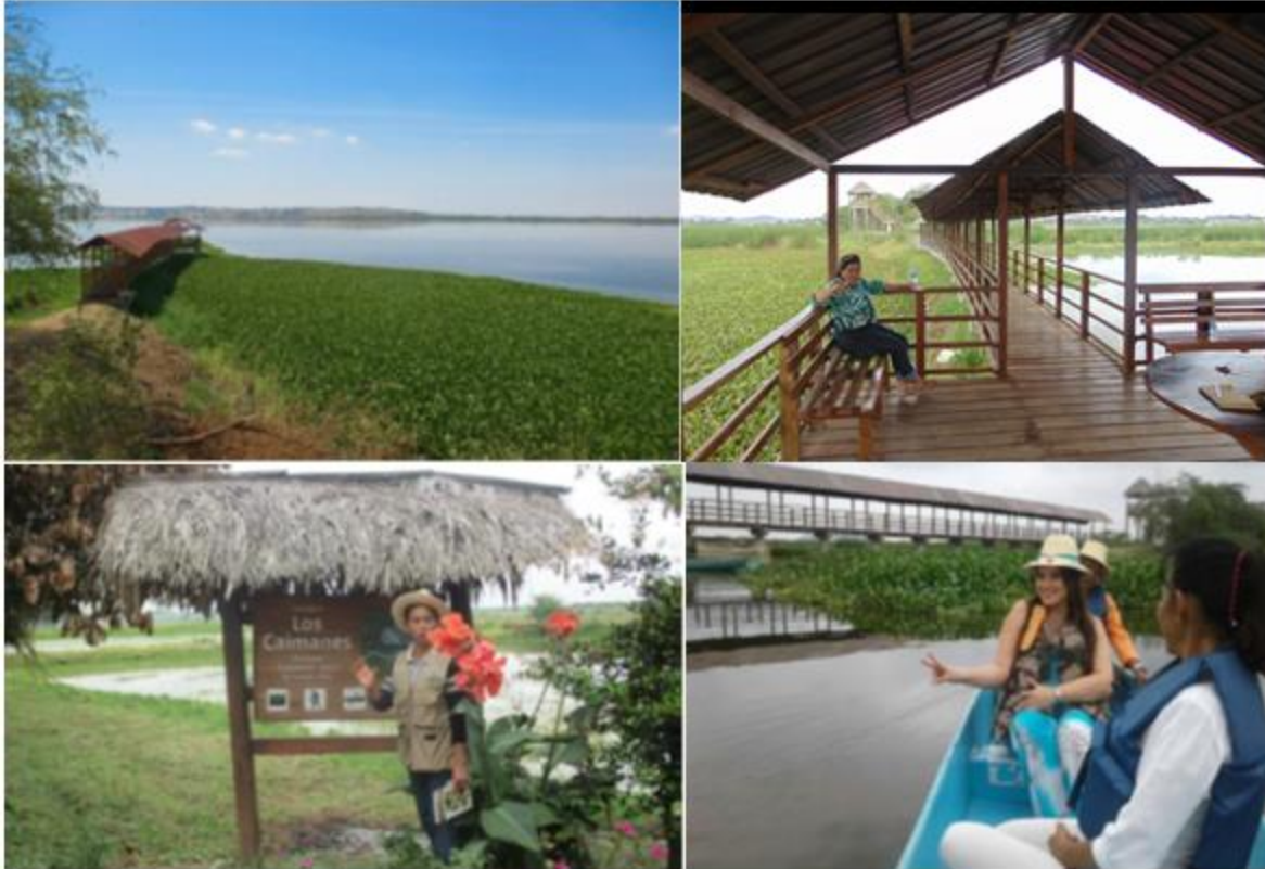
Figura 3. Humedal La Segua.

Las iniciativas turístico-recreativas y de desarrollo sostenible en espacios naturales como éste, tal como aconsejan diversos organismos internacionales y ONGs experimentados en estudios de caso (Font, Cochrane y Tapper, 2004; OMT, 2004; Van der Duim y Henkens, 2007), han de emplear técnicas de participación público-privada y herramientas de planificación -ahora inexistentes en la gestión del humedal- que lidien con posibles conflictos de intereses entre propietarios privados y otros agentes de actividades económicas y los involucren en el desarrollo proyectos de turismo sostenible y comunitario. El análisis de dichas técnicas y herramientas va más allá del alcance de esta publicación, como podrá entenderse, pero podemos afirmar que la clave para planificar, acertada y eficazmente, el desarrollo turístico sostenible en los humedales es integrando aspectos técnicos en el proceso de planificación (por ejemplo, la administración de recursos y visitantes, la ordenación de