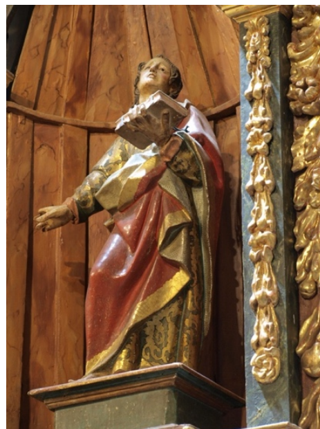
Fig. 15. San Juan Evangelista , atrib. Taller de Alonso de Mena, primera mitad del siglo XVII. Iglesia parroquial de Nuestra Señora de la Expectación, Órgiva (Granada).