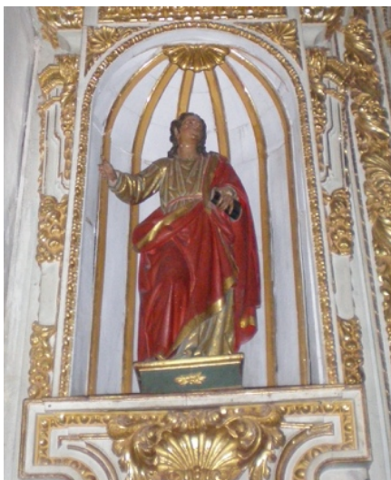
Fig. 8. San Juan Evangelista , atrib. Alonso de Mena, c. 1613. Iglesia parroquial de El Salvador, Albuñuelas (Granada).