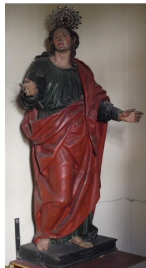
Fig. 7. San Juan Evangelista , atrib. Alonso de Mena, c. 1613. Convento del Santo Ángel Custodio (dependencias interiores), Granada.

Sin lugar a dudas, el discípulo de mayor envergadura de Pablo de Rojas será Alonso de Mena (1587-†1646). Algo más alejado en el tiempo que los anteriores, perpetúa las esencias del maestro hasta ir configurando un estilo marcadamente propio. Su obra, tremendamente prolífica, va a estar marcada por la ausencia de otros escultores (una vez