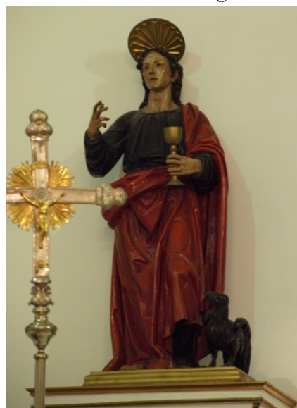
Fig. 4. San Juan Evangelista , atrib. Bernabé de Gaviria, primer cuarto del siglo XVII. Iglesia del Convento de Santa Catalina de Siena, Granada.