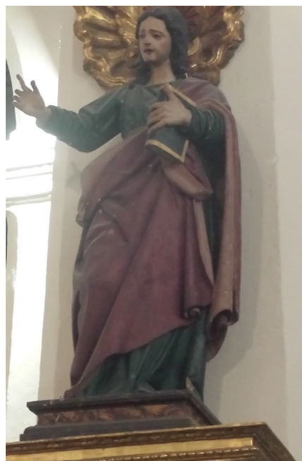
Fig. 3. San Juan Evangelista , atrib. Bernabé de Gaviria, primer cuarto del siglo XVII. Iglesia parroquial de Nuestra Señora de la Asunción, La Zubia (Granada).

En este sentido, consideramos que otras esculturas joánicas relacionadas con sus gubias serían la que se halla en el templo parroquial de la localidad granadina de La Zubia [Fig. 3]. La misma, que por la pose intuimos que debió componer la escena de un Calvario o al menos de servir para el acompañamiento procesional de alguna escena pasionista, en la actualidad se encuentra exenta en una repisa del lado de la epístola de la iglesia. Viste túnica verde y manto rojo terciado de izquierda a derecha. Aunque el color de la túnica no sea el clásico que se apunta en la tratadística 50 , quizás venga a evocar el tema de la esperanza al ser considerado el autor del Apocalipsis, libro que trata acerca de la vida tras la muerte, así como una alusión a la redención, pues el color verde también se ha relacionado con el “árbol de la cruz” 51 . Curiosamente, esa tonalidad se hace genérica en la totalidad de ejemplos que planteamos en este trabajo. Con la mano izquierda sujeta junto a su regazo uno de sus atributos clásicos, el libro, como escritor sagrado que es; su brazo derecho se alza,