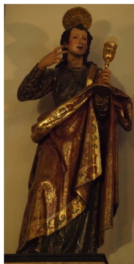
Fig. 9. San Juan Evangelista , atrib. Alonso de Mena, c. 1613-1629. Iglesia parroquial de La Inmaculada Concepción, Dilar (Granada).