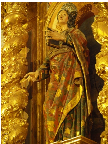
Fig. 14. San Juan Evangelista , atrib. Taller de Alonso de Mena, primera mitad del siglo XVII. Iglesia de Santa María de la Cabeza, Ogíjares (Granada).

Finalmente, hemos de hacer alusión a otras imágenes, de bastante menor calidad, que consideramos que forman parte de ese elenco de esculturas de taller, de factura más tosca, pero que vienen a cubrir sobradamente su función cultural para lo que fueron concebidas. Nos referimos a las tallas de San Juan de las localidades de Ogíjares [Fig. 14] 75 , en la iglesia de Santa María de la Cabeza, y la del templo parroquial de Órgiva [Fig. 15].