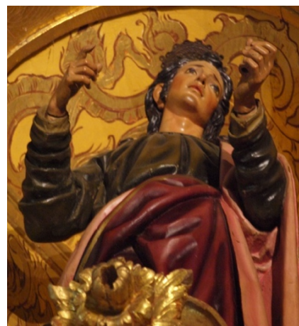
Fig. 5. San Juan Evangelista , atrib. Bernabé de Gaviria, primer cuarto del siglo XVII. Iglesia parroquial de San Juan Bautista, Melegís (Granada).