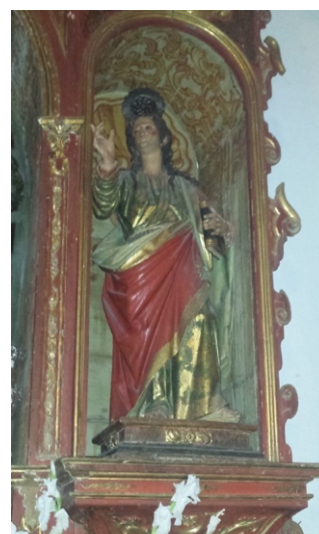
Fig. 10. San Juan Evangelista , atrib. Alonso de Mena, c. 1620. Iglesia parroquial de La Visitación de Nuestra Señora, Churriana de la Vega (Granada).