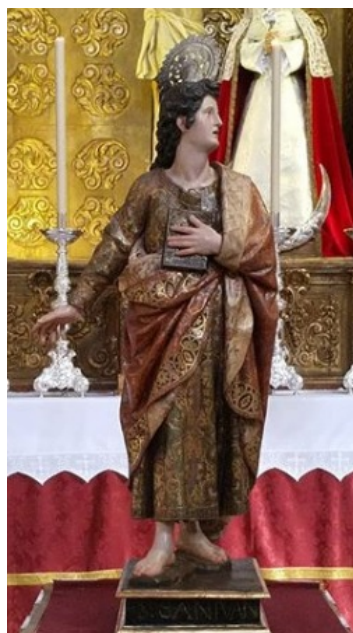
Fig. 1. San Juan Evangelista , atrib. Pablo de Rojas, finales del siglo XVI. Iglesia parroquial de La Encarnación, Las Gabias (Granada).

La escuela granadina de escultura, propiamente dicha, comenzará su andadura en el último tercio del siglo XVI con la figura del escultor de Alcalá la Real (Jaén), Pablo de Rojas (1549-†1611). El que fuera maestro de Martínez Montañés, elaborará una gran variedad de prototipos iconográficos, perpetuándose en el tiempo a través de varios de sus discípulos, como por ejemplo Bernabé de Gaviria o ya en las postrimerías, Alonso de Mena. Uno de estos modelos será el de San Juan Evangelista. Quizás el primer prototipo que realiza de esta imagen sea el de la parroquial de la localidad de Las Gabias [Fig. 1], un ejemplo en el que destaca la elegancia y la belleza clasicista, así como la rotundidad en sus formas. En el rostro se vislumbra el semblante romanista del comienzo de su obra, ejecutado de perfil, una herencia proveniente de los tipos realizados por Diego de Pesquera 38 . Asimismo, aúna la tipología de paños del segundo tercio del siglo XVI. Resulta curioso el pliegue del brazo izquierdo que se oculta debajo del brazo, tensando el tejido desde el hombro hacia la extremidad. Este detalle es apreciable también en imágenes como el San Juan de la iglesia de San Francisco de Priego de Córdoba (Córdoba) o la Dolorosa del Calvario del retablo mayor de Albolote.