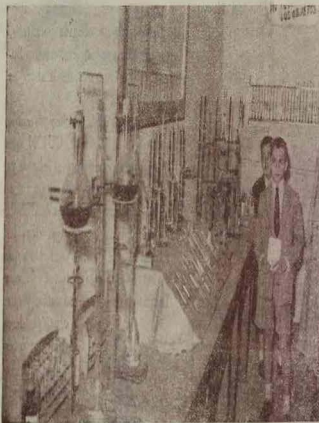
SECCIÓN DE EMPUJAMIENTO EN LA EXPOSICIÓN DE MATERIAL.—Fotografía tomada por la S. G. A.

Meditemos todos ante esta realidad y pensemos si no habrá también algo de culpa nuestra al no haber aprovechado los medios de observación que se nos ofrecen. Y sobre todo, no nos olemos nunca por satisfechos con una simple referencia de los hechos, la cual, unas veces, puede ser incompleta, y otras, incluso adulterada.