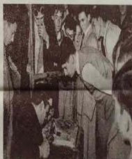
Alumnos en el taller de la Escuela de Petróleo en Lucena de Sevilla

De esta forma nuestros pequeños alumnos, a la vez que hallan un descanso en sus jornadas escolares, van incrementando el conocimiento directo de nuestro suelo patrio y aplicando a la práctica los fundamentos adquiridos en las clases teóricas.