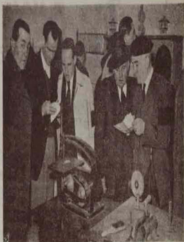
SIERRA DE CALAY

Aparte de su asistencia al Congreso, realizó gestiones en orden al intercambio entre España y Cuba de estudiantes de Formación Profesional y Social, y sobre la posibilidad de que en el Colegio de Belén pudiesen los muchachos de la colonia española cursar el Bachillerato español. Terminada su estancia en Cuba, salió para Panamá donde durante tres días visitó dependencias de Formación Profesional y otros Centros de Enseñanza.—De allí marchó a Lima, donde fué recibido por el Presidente de la República, General Odría. Posteriormente visitó México, Chile y Argentina, asistiendo, finalmente, como representante de España, al II Congreso Iberoamericano de Seguridad Social celebrado en Brasil.