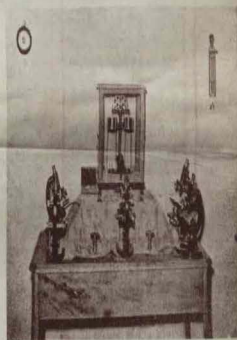
ACCESORIOS Y MUEBLES DE FERRON

El concurso oposición se anunciará, para este Instituto, en el próximo mes de junio. Iniciórase, en el Instituto.