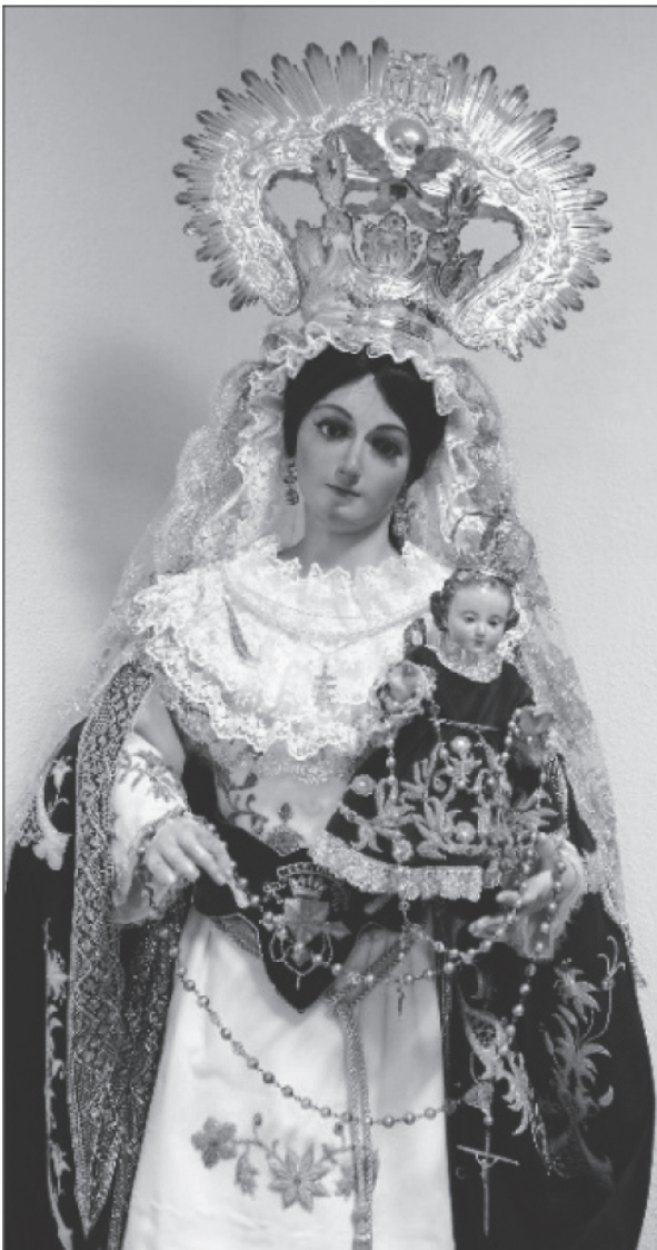
Figura 1: Detalle de la Virgen del Rosario, imagen de vestir que demuestra la profusa utilización de ricas telas bordadas con hilos de oro y plata, engarces de perlas y piedras preciosas, así como variedad de alhajas y accesorios realizados en plata y oro. Monasterio de Santa María de Gracia.

que embellecen las imágenes de candelero ya marianas ya de santas de la orden: anillos, pendientes, cadenas, crucifijos, rosarios, puñales... Estas joyas de oro podían estar enriquecidas con engarces de perlas, corales o gemas de alto valor, por lo que se daba explícita constancia de su composición y, a veces, de su tamaño y precio estimado. De igual modo, las coronas de espinas, aureolas y potencias de plata dorada se documentan para las imágenes cristológicas, niños Jesús y crucificados; así como los santos de la orden también fueron destino de piezas realizadas con el material aurífero: la estrella de su frente y el escudo de la orden para Santo Domingo; la pluma, el toisón o cadena con una figura solar para Santo Tomás de Aquino.