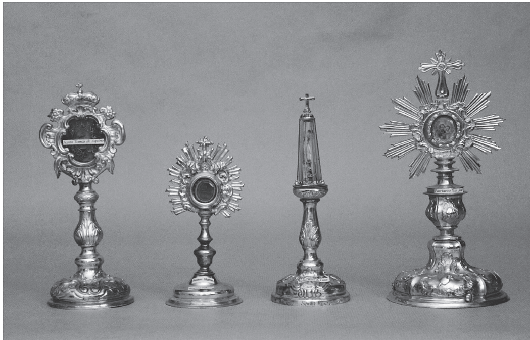
Figura 2: Una muestra que ilustra el uso de relicarios de plata con los que cuentan las dominicas cordobesas. Monasterio de Santa María de Gracia.