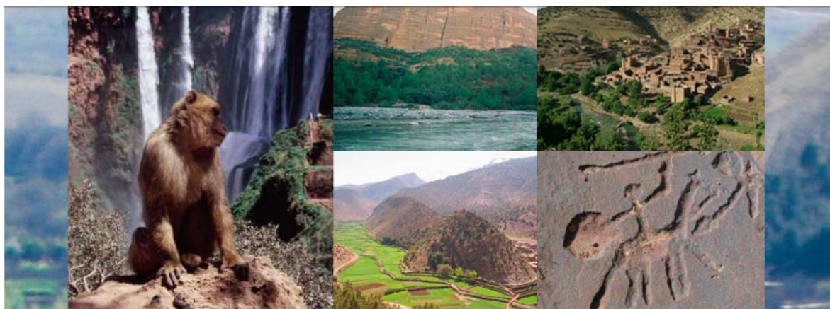
Figure 2: capture d'image présentant le patrimoine du Géoparc M'goun