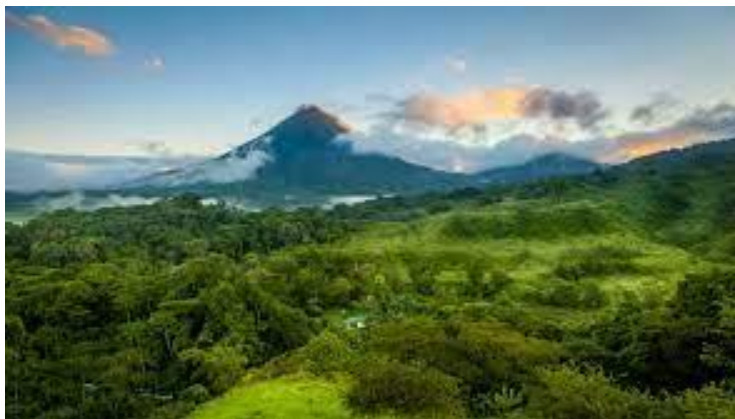
Figure 4: capture d'image présentant le patrimoine naturel du Costa Rica.

Du Costa Rica: Le Costa Rica a de nombreux atouts pour séduire les amateurs de tourisme vert, à commencer par sa faune et sa flore. ... Ce petit pays d'Amérique centrale a également réussi à stopper la déforestation en développant un écotourisme de qualité à la place de la culture des bananes et du café.