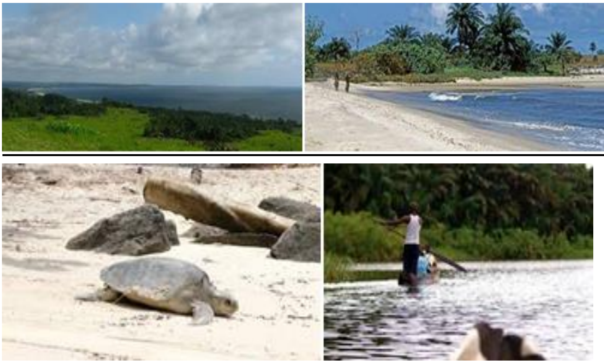
Figure 8: Image présentant la biodiversité de la Baie de Loango