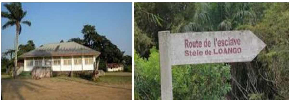
Figure 9 : Image présentant le Musée et la route d'esclaves de la Baie de Loango