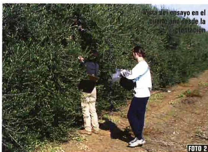
Vista del ensayo en el olivarano desde la plantación

Otra de las incógnitas aún no despejada en este tipo de plantaciones es la elección de variedades. Ante la falta de variedades de reducido vigor, se están empleando los cultivares de mayor precocidad de entrada en producción. Así, aunque Arbequina es la variedad más empleada, hay otras como Arbosana o Koroneiki que empiezan a utilizarse.