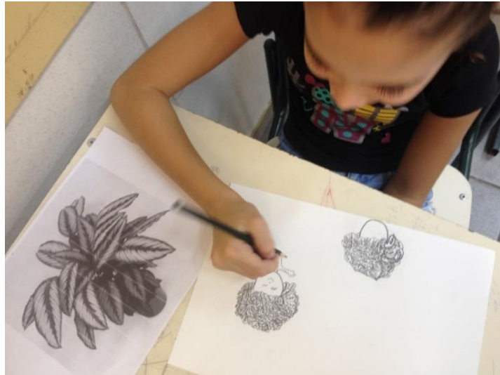
Figura 3. Estudiante en taller de dibujo.

En relación a los estudiantes que mostraron más interés, se ofrecieron otros materiales sobre arte. Otra valorización fue por los diferentes tipos de arte y de esta manera, los alumnos descubrieron que era posible crear a través de la interdisciplinariedad, ya que como había un proyecto en proceso "¿Desperdicio? ¡Basta!", crearon obras de arte a través de la mirada de la sostenibilidad, dando nuevas formas y utilidades para lo que se desperdiciaría (Figura 4).