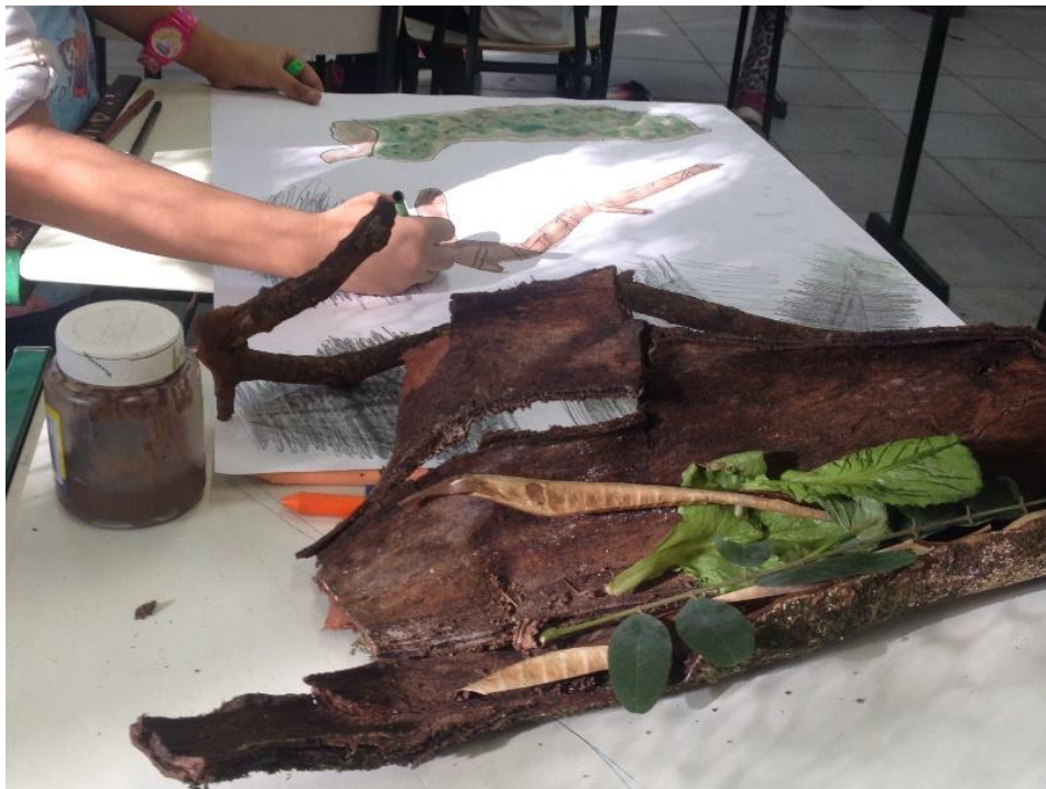
Figura 4. Taller de dibujo.

En relación a los estudiantes que mostraron más interés, se ofrecieron otros materiales sobre arte. Otra valorización fue por los diferentes tipos de arte y de esta manera, los alumnos descubrieron que era posible crear a través de la interdisciplinariedad, ya que como había un proyecto en proceso "¿Desperdicio? ¡Basta!", crearon obras de arte a través de la mirada de la sostenibilidad, dando nuevas formas y utilidades para lo que se desperdiciaría (Figura 4).