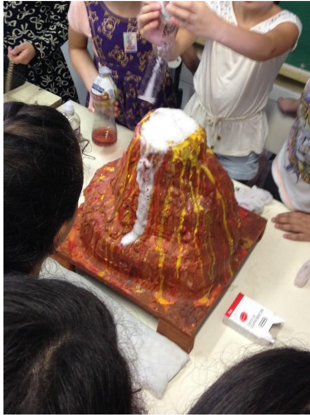
Figura 1. Presentación de volcán creado.

Otra estudiante se destacó por su talento psicosocial en el instrumento Ficha de Ítems para la Observación en el Aula (Guenther, 2000), en producciones textuales y mostró interés en producir una obra teatral.