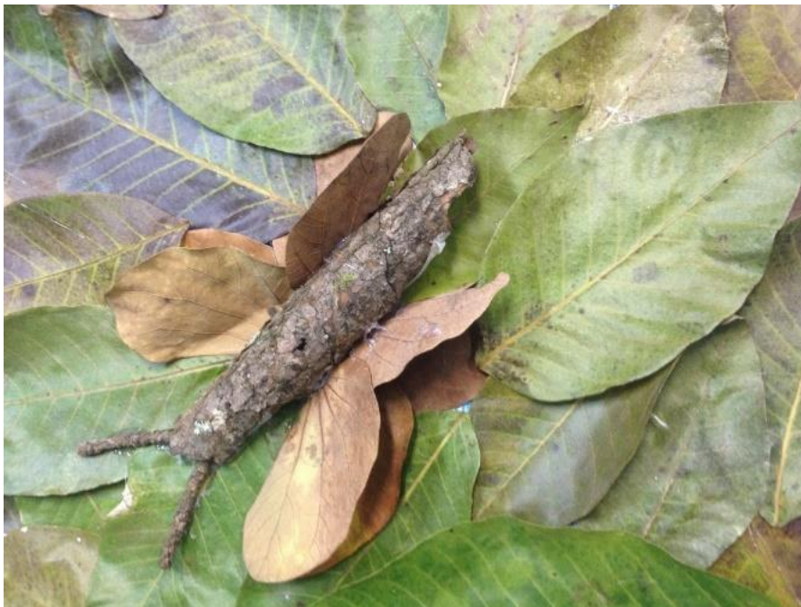
Figura 5. "Camuflaje". Obra creada por estudiantes.

Las obras de arte de los estudiantes fueron valoradas y exhibidas en la propia escuela (Figura 5).