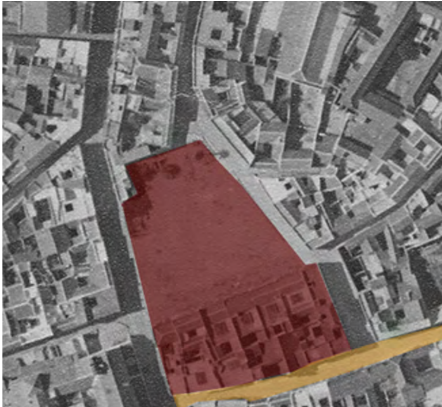
Figura 2. Foto aérea del solar donde posteriormente se construiría la Plaza del Ayuntamiento de Marchena. Tomada en el año 1957. En color rojo aparece reflejado el espacio que ocupó el convento de san Francisco de Marchena y en color ocre la actual calle san Francisco. AYUNTAMIENTO DE MARCHENA (ed.) Marchena 300 imágenes del pasado. Marchena, 2004. p. 58. (Realización propia del marcado de la zona 30/04/2019).

Previamente a la fundación de este convento, en la villa se había fundado el convento de san Pedro Mártir en el año 1517 pero, a diferencia del anterior, el convento de san Francisco se fundó intramuros, lo que supuso un cambio urbanístico, debido en parte a su origen como casa propia (vid. Fig. 2) 25 .