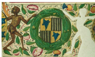
ILUSTRACIÓN 33. WAM W.420, f. 120v