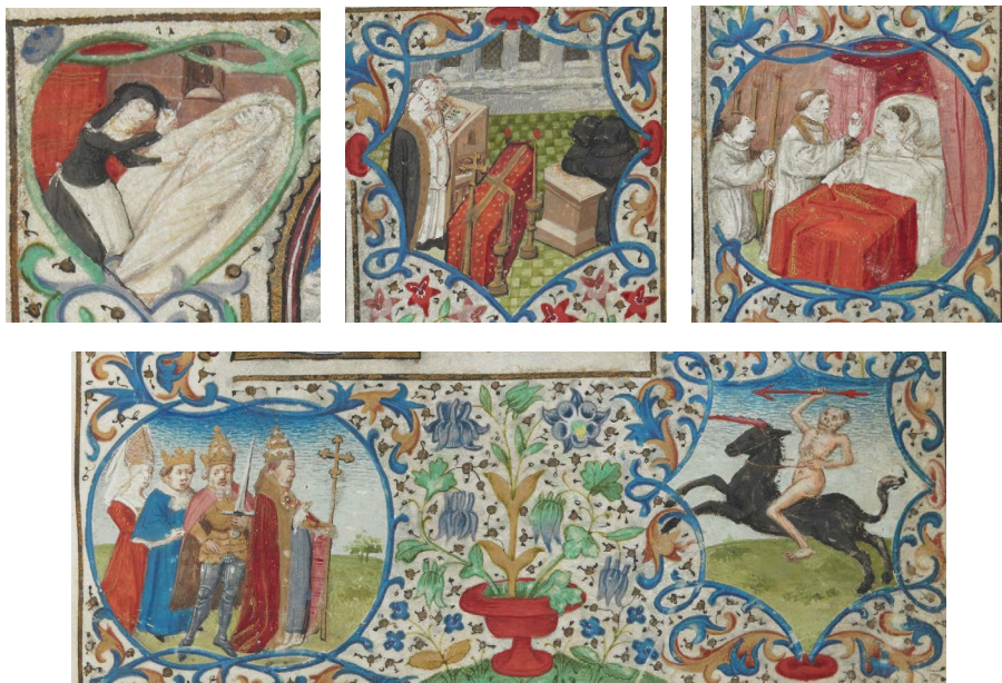
ILUSTRACIÓN 12a. BL Egerton MS 2019, f. 142r (detalles)