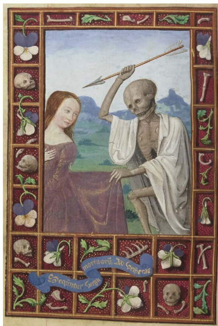
ILUSTRACIÓN 27. BnF NAL 3210, 87v

76v [il. 27]) y a distintos estamentos (BL Egerton MS 2019, f. 142r [il. 12]; Bibliothèque municipale de Metz Ms. 1598, f. 68r). También cabe encontrar la iconografía del cadáver en distintas fases de descomposición (WAM W.239, f. 101v; BL Add MS 17280, f. 280v; BnF NAL 3191, f. 100v [il. 24]). La crítica ha dedicado singular atención a la presencia de textos de tema profano y a su presentación dentro de los libros de horas, como la leyenda del encuentro –pacífico o agresivo– entre los tres vivos y los tres muertos (BL Stowe MS 17, ff. 199v-200r [il. 28]; PML MS M.14, f. 130; PML MS S.7, f. 183r [il. 29]; PML MS M.14, f. 130v [il. 30]; BL Add MS 35313, f. 158v) y la danza de la muerte 27 (PML MS M.359, ff. 123v-151r conserva el más temprano ciclo conservado –compuesto por 56 pequeñas escenas insertas en orlas [il. 31]–; o como en el magnífico Libro de horas de Carlos V , con la danza macabra de hombres y mujeres, BNE Vitr. 24/3, pp. 221-242) 28 .