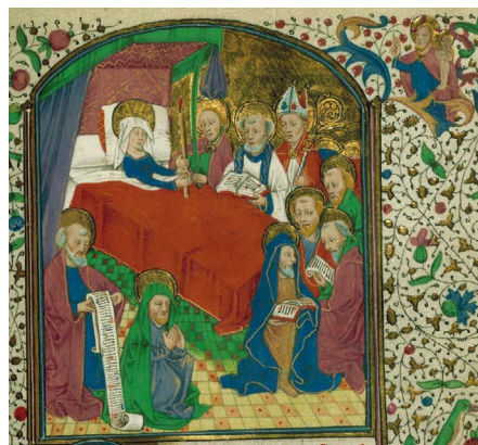
ILUSTRACIÓN 22. WAM W.269, f. 116rv