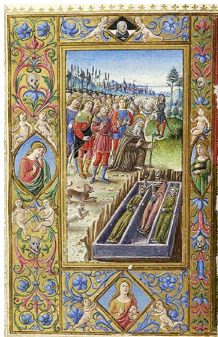
ILUSTRACIÓN 30. PML MS M.14, f. 130v