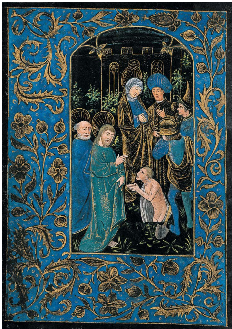
ILUSTRACIÓN 14. PML MS M.493, f. 93v