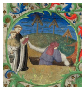
ILUSTRACIÓN 11a. BL Add MS 18850, f. 120r (detalles)