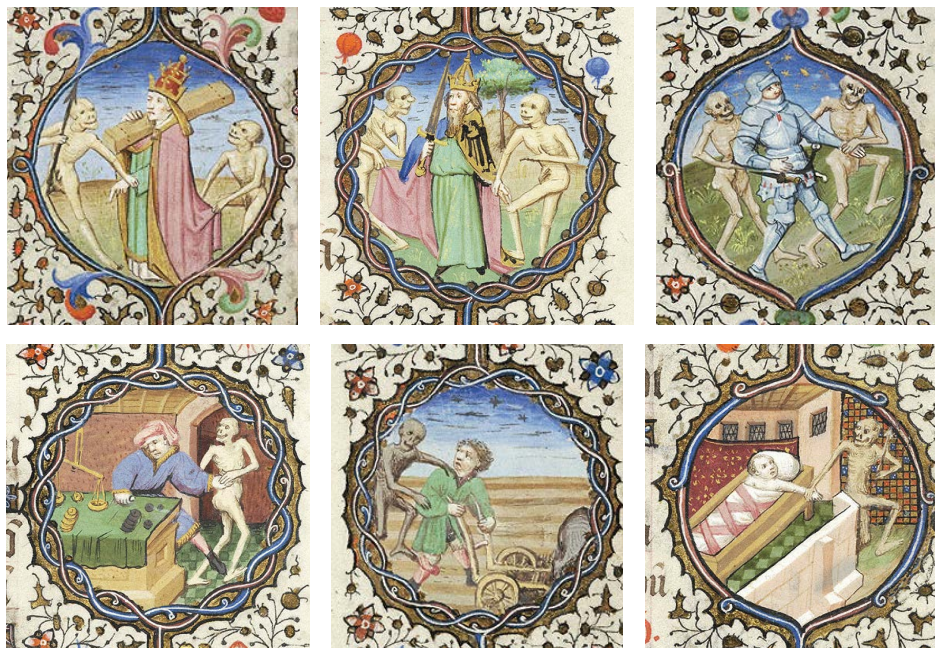
ILUSTRACIÓN 31. PML MS M.359, ff. 123v-151r (detalles: 123v, 124r, 131v, 144r, 146v, 151r)

7) En general, la ornamentación de los márgenes y las orlas no presenta decoraciones relativas a la muerte: en contados casos pequeñas imágenes representan ángeles, santos, figuras encapuchadas y afligidas (PML MS M.357, f. 118v). Es posible notar un cambio de tendencia a partir de la segunda mitad del siglo xv, fruto del aumento de motivos macabros como calaveras, esqueletos y huesos, además de esquelas mortuorias y rótulos con inscripciones funerarias (BL Add MS 50002, f. 85r [il. 25]; BnF NAL 3210, f. 76v [il. 27]; WAM W.420 [il. 33], f. 120v; BL Add MS 38126, f. 151r [il. 34]; PML MS M.80, ff. 109r, 112v, 121r, 124v, 126v, 142v; WAM 427, ff. 164-165r).