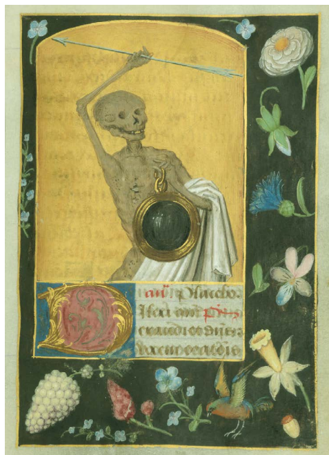
ILUSTRACIÓN 26. WAM W.431, f. 115r