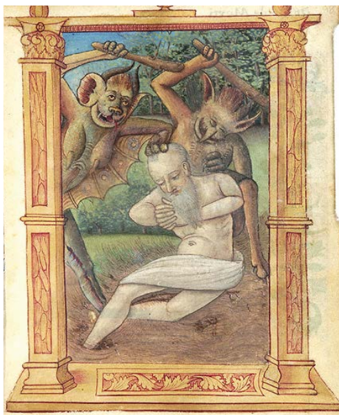
ILUSTRACIÓN 17. PML MS M.510, f. 98r