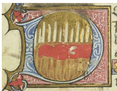
ILUSTRACIÓN 1. BnF Latin 10527, f. 16v

2) Sin duda, la imagen que más se repite es la celebración del Oficio de Difuntos 26 : ya sea esta una simple vigilia (como pequeña escena exenta o capital historiada) en la que aparece el muerto arreglado o el féretro cubierto, acompañado de velas (BnF Latin 10527, f. 16v [il. 1]; BL Add MS 38126, f. 179r [il. 2]), junto a unos pocos asistentes cantando o encapuchados en actitud doliente (WAM W.90, f. 194v, capital historiada [il. 3]; BL Sloane MS 2683, f. 82v, toda página [il. 4]), ya se trate de representaciones realmente complejas (que ocupan toda la página o más de dos tercios), llenas de detalles arquitectónicos y repletas de personajes.