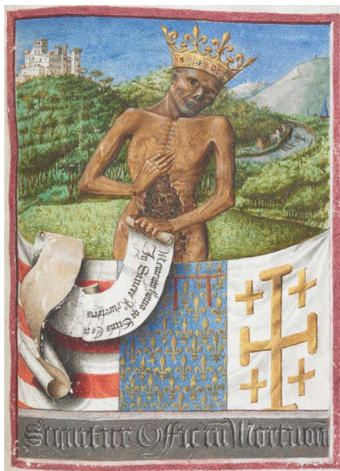
ILUSTRACIÓN 23. BL Egerton MS 1070, f. 53r

6) La personificación de la Muerte es otro tópico muy significativo: triunfante con corona (BL Egerton MS 1070, f. 53r [il. 23]), montada en un buey (BNE Vitr. 22/2, f. 104r; BnF NAL 3191, f. 100v [il. 24]) o como jinete ecuestre (BL Egerton MS 2019, f. 142r [il. 12]; PML MS M.854, f. 161v), volando (BL Yates Thompson MS 30, f. 83r), con guadaña (BL Add MS 50002, f. 85r [il. 25]), flecha única sin aljaba, quizá como el anverso de las de cupido (PML MS M.1160, f. 105r), lanza/as (BNL IL-1, f. 112v) o espejo (WAM W.431, f. 115r [il. 26]); persiguiendo a jóvenes o a doncellas (PML MS S.5, f. 144r; BnF NAL 3210,