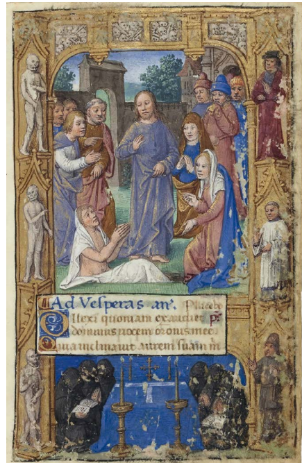
ILUSTRACIÓN 15. BnF Latin 3120, f. 102r