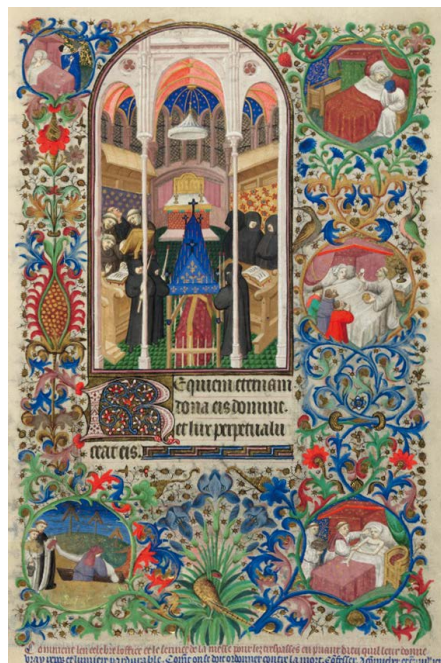
ILUSTRACIÓN 11. BL Add MS 18850, f. 120r