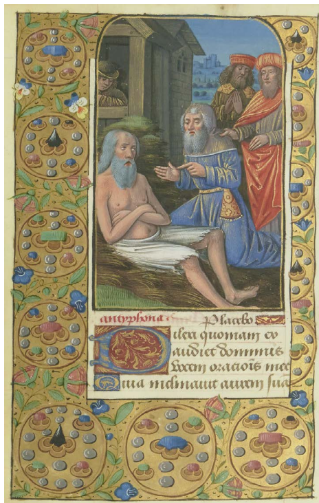
ILUSTRACIÓN 16. BNF Latin 1374, 108v

faltan las variantes: Marta y María suplicando el milagro (BL Add MS 20927, f. 119v), la parábola del rico Epulón y el pobre Lázaro (BNE Vitr. 24/3), la soledad de Job en el mular (Bibliothèque de l' Arsenal, Ms-1187 réserve, f. 117v) o con los tres amigos (PML MS W.30, f. 127r), golpeado por unos demonios (PML MS M.510, f. 98r [il. 17]), y otros lances de su historia, a veces en pequeñas escenas secuenciadas (BNE Res. 187, ff. 98v-119v; BL Egerton MS 2019, 156v-177v). Además, las historias de Lázaro y de Job también pueden contraponerse en páginas sucesivas (Bibliothèque municipale de Dijon Ms 2244, ff. 49v-50r) o bien en la misma (BNE Vitr. 25/3, f. 143v [il. 18]).