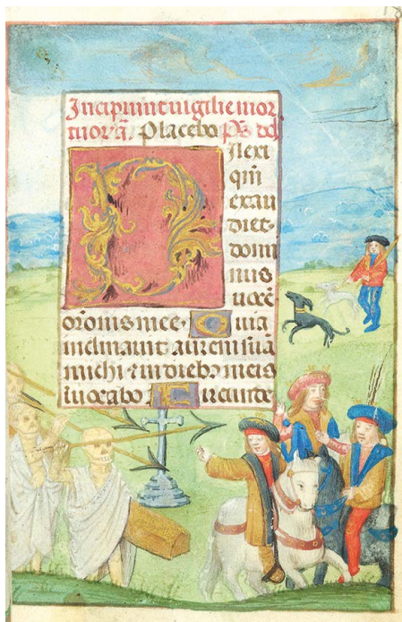
ILUSTRACIÓN 29. PML MS S.7, f. 183r