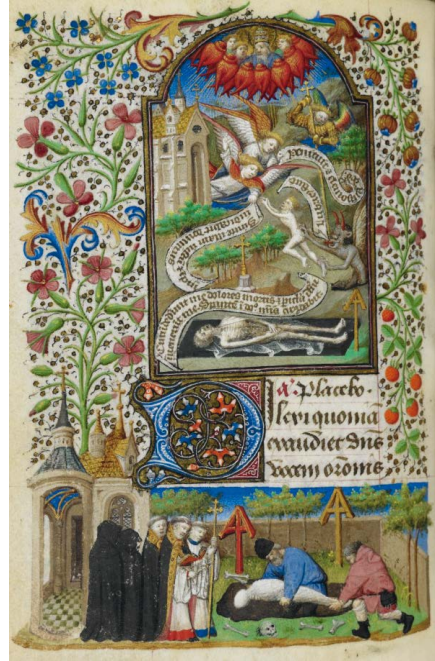
ILUSTRACIÓN 13. BL Yates Thompson MS 3, 201v

4) La resurrección de Lázaro (ejs. PML MS M.493, f. 93v [il. 14]; WAM W.435, 128v; BnF Latin 3120, f. 102r [il. 15]) y la postración de Job en el muladar (BnF Latin 1374, f. 108v [il. 16]) son los siguientes episodios más representados, en particular a partir de mediados del siglo xv. En la mayoría de estos ejemplos se plasma el tema principal de la narración, pero no