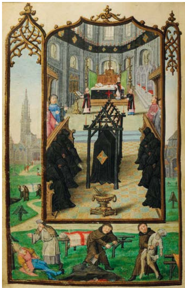
ILUSTRACIÓN 7. PML MS M.1175, 124v

Estas escenas funerarias se desarrollan en una iglesia, con suelo de baldosas, ventanas de vidrio emplomado y bóveda de crucería; o bien en una capilla ardiente, iluminada con hachones, decorada con flores y cruces. En cualquier caso, a un lado de los sitiales del coro aparecen hombres salmodiando junto a un cantoral sobre un facistol y, al otro, sacerdotes tonsurados y dolientes encapuchados. Igualmente se aprecia otro grupo de monjes encapuchados con velas encendidas que miran desde detrás de los puestos del coro y, en el fondo, el altar (BNE Ms. 21547, f. 146v; BNE Vitr. 25/5, f. 238r [il. 5]; BNP IL-165, f. 114v [il. 6]; BL Egerton MS 1070, f. 54v; PML MS M.1175, 124v [il. 7]).