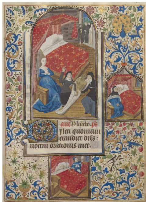
ILUSTRACIÓN 10. Bibliothèque de l' Arsenal Ms-1196 réserve, f. 133r