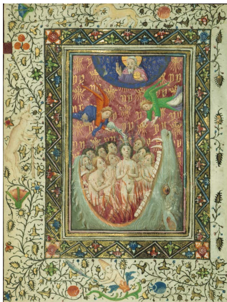
ILUSTRACIÓN 19. WAM W.211, f. 23v

5) Otros motivos recurrentes son el Juicio Final, con la resurrección de los difuntos, la boca del infierno y los castigos allí infligidos (BL Add MS 29433, f. 115v; WAM W.211, f. 23v [il. 19]; BL Add MS 18850, f. 157r; BNE Vitr. 25/5, f. 238r [il. 5]), el descenso de Cristo al infierno para liberar las almas de los justos (BL Stowe MS 17, 187v [il. 20]; WAM W.918, f. 149v), más imágenes del purgatorio (WAM W.168, f. 167r [il. 21]) y de la Virgen intercediendo por el alma de un pecador (BL Yates Thompson MS 13, f. 151r), o bien en su tránsito (WAM W.269, f. 116r [il. 22]; BnF Latin 1403, f. 99r).