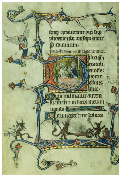
ILUSTRACIÓN 3. WAM W.90 194v