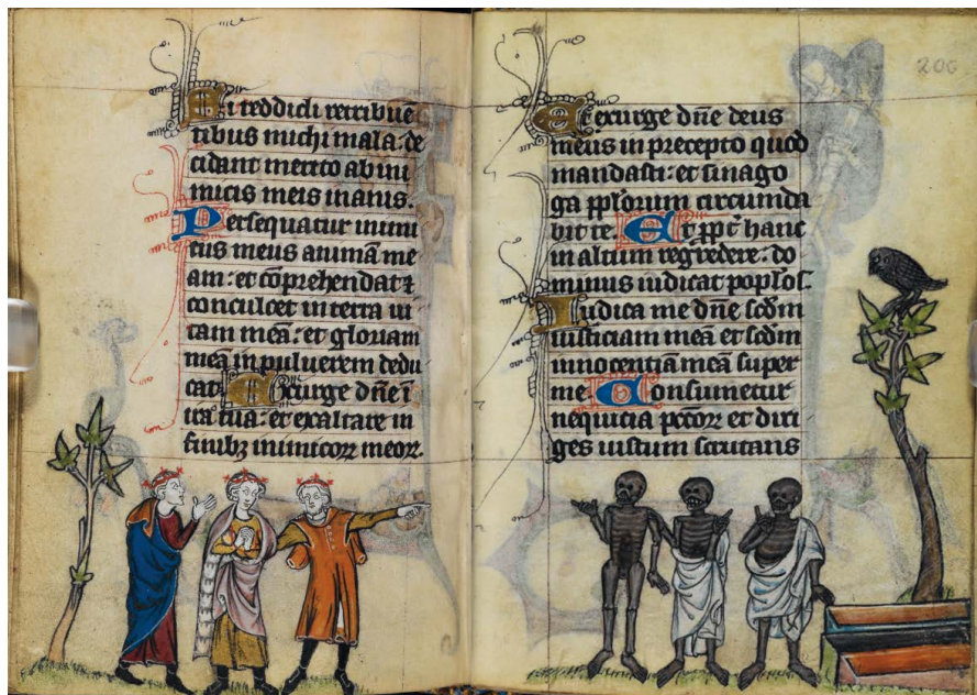
ILUSTRACIÓN 28. BL Stowe MS 17, ff. 199v-200r