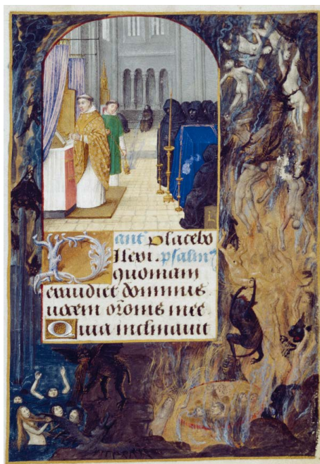
ILUSTRACIÓN 5. BNE Vitr. 25/5, f. 238r