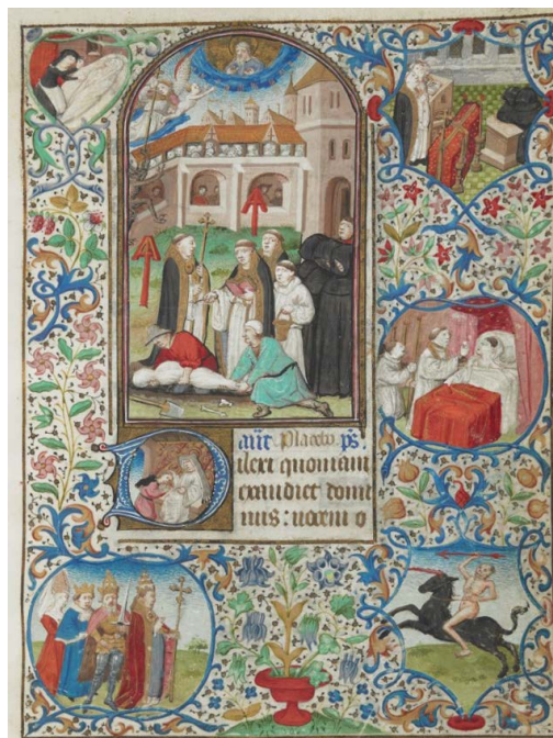
ILUSTRACIÓN 12. BL Egerton MS 2019, f. 142r