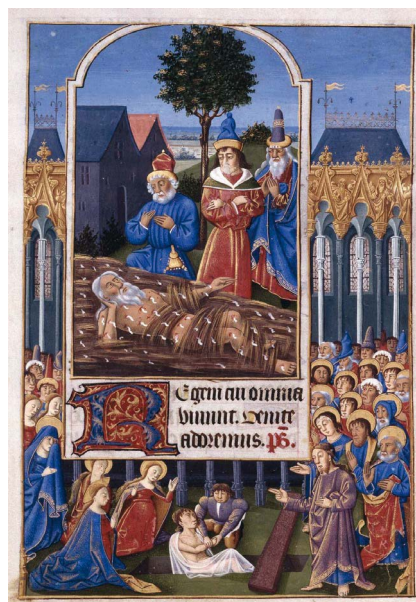
ILUSTRACIÓN 18. BNE Vitr. 25/3, f. 143v