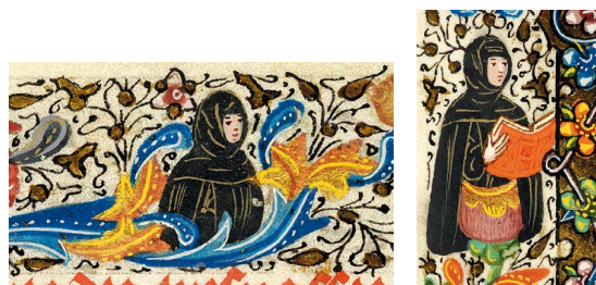
ILUSTRACIÓN 32. PML MS M.357, f. 118v (detalles)

7) En general, la ornamentación de los márgenes y las orlas no presenta decoraciones relativas a la muerte: en contados casos pequeñas imágenes representan ángeles, santos, figuras encapuchadas y afligidas (PML MS M.357, f. 118v). Es posible notar un cambio de tendencia a partir de la segunda mitad del siglo xv, fruto del aumento de motivos macabros como calaveras, esqueletos y huesos, además de esquelas mortuorias y rótulos con inscripciones funerarias (BL Add MS 50002, f. 85r [il. 25]; BnF NAL 3210, f. 76v [il. 27]; WAM W.420 [il. 33], f. 120v; BL Add MS 38126, f. 151r [il. 34]; PML MS M.80, ff. 109r, 112v, 121r, 124v, 126v, 142v; WAM 427, ff. 164-165r).