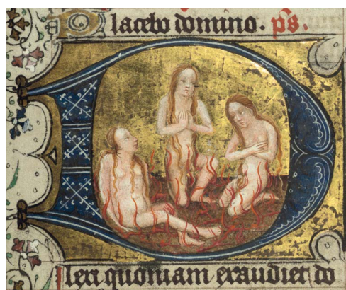
ILUSTRACIÓN 21. WAM W.168, f. 167r