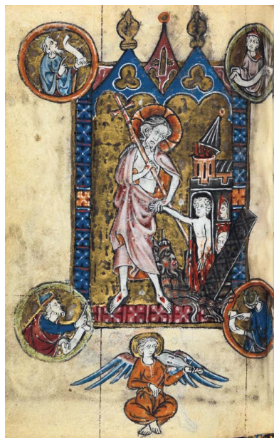
ILUSTRACIÓN 20. BL Stowe MS 17, 187v