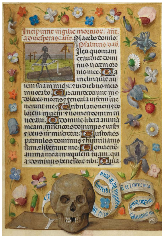
34. BL Add MS 38126, f. 151r

La importancia del vínculo texto-imagen, así como su interdependencia en los libros litúrgicos resulta innegable. En palabras de Mâle (1910 [1898]: 34), «les artistes furent aussi habiles que les théologiens à spiritualiser la matière: ils curent des inventions dont quelques-unes furent ingénieuses, d'autres touchantes, d'autres grandioses». Así, en este artículo hemos querido elaborar un primer listado de motivos que acompañan al Oficio y a las plegarias de difuntos insertos en los libros de horas manuscritos, empresa que deberá ampliarse en próximos trabajos con el fin de completar el panorama del imaginario asociado a estas oraciones. Por ahora solo se puede apreciar el caudal de imágenes que, en una segunda etapa, permitirá desbrozar la influencia de la sociedad y de sus gustos, así como las inquietudes religiosas y otras preocupaciones vitales de los poseedores de estos libros, sin olvidar la importancia del proceso creativo de estos singulares manuscritos difundidos durante la Baja Edad Media.