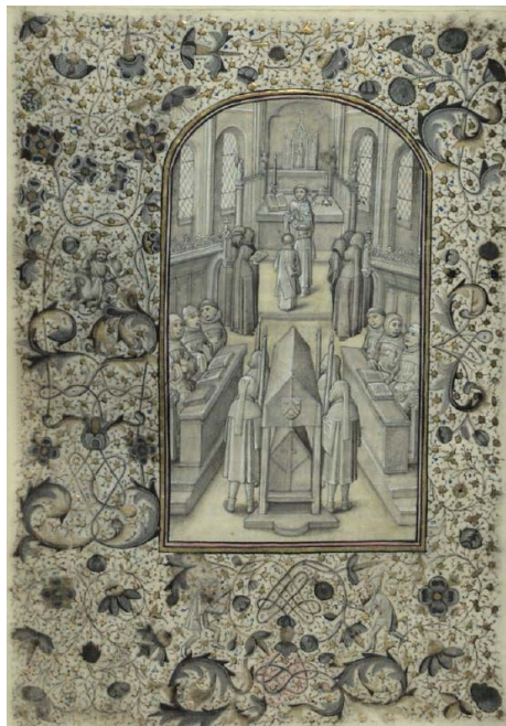
ILUSTRACIÓN 6. BNP IL-165, f. 114v