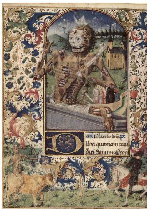
ILUSTRACIÓN 24. BnF NAL 3191, f. 100v