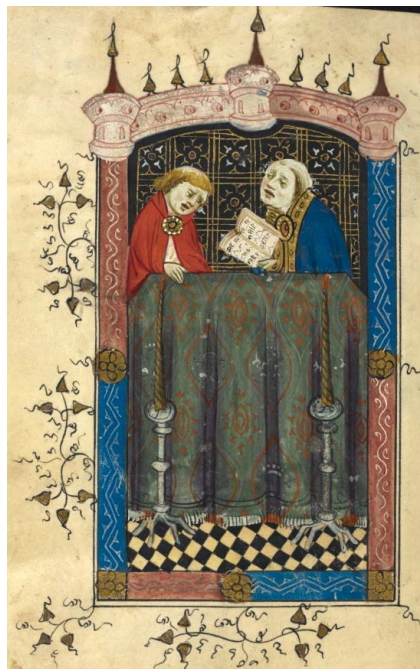
ILUSTRACIÓN 4. BL Sloane MS 2683, 82v