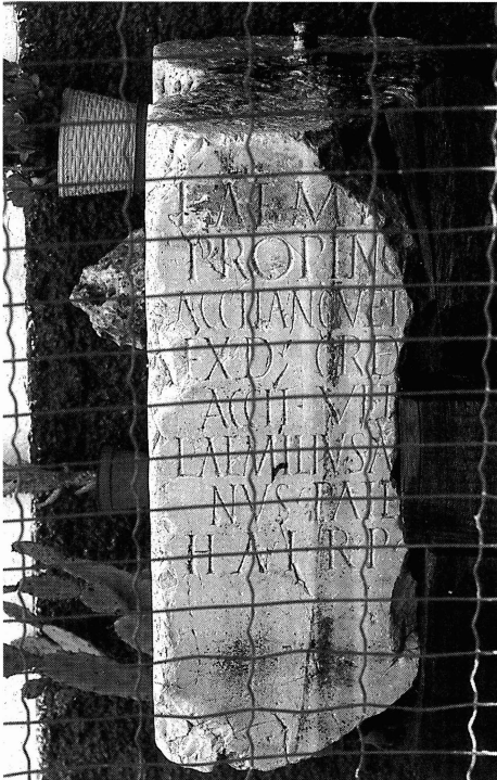
Fig. 1. Pedestal de L. Aemilius Propinquus, procedente del Cortijo de Periate.