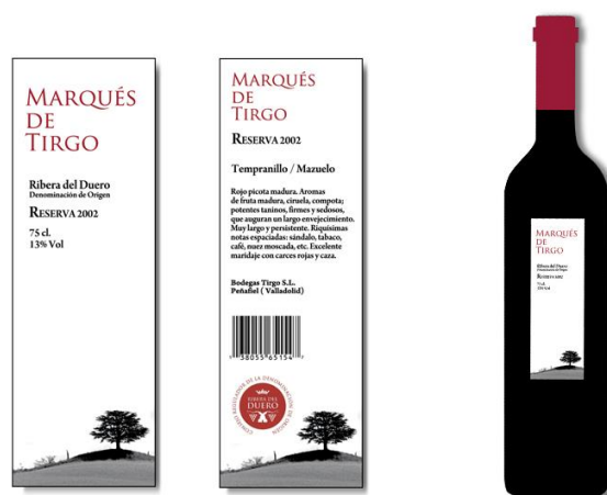
Figura 1. Etiquetas delantera y trasera de vino embotellado 6 .