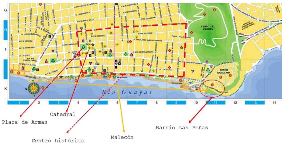
Figura 2 - Centro histórico de Guayaquil, Malecón y Barrio Las Peñas.

Por otro lado, encontramos en el centro urbano de Guayaquil -considerado este desde una perspectiva de centralidad geográfica- algunos edificios antiguos y de cierto interés patrimonial, a través de los cuales se pueden comprender los cambios de estilos arquitectónicos que se han ido sucediendo en la ciudad, así como identificar sus usos actuales y cambios funcionales recientes. Un ejemplo se encuentra en la calle Boyacá, donde pueden observarse edificaciones construidas entre 1925 y 1930, reconocidas como patrimonio de la ciudad, aunque no se encuentran integradas propiamente en la oferta del turismo cultural urbano debido a que tanto los agentes turísticos y los guías locales como el público en general no los identifican como elementos arquitectónicos de importancia y con capacidad suficiente y destacable para atraer a los flujos de visitantes.