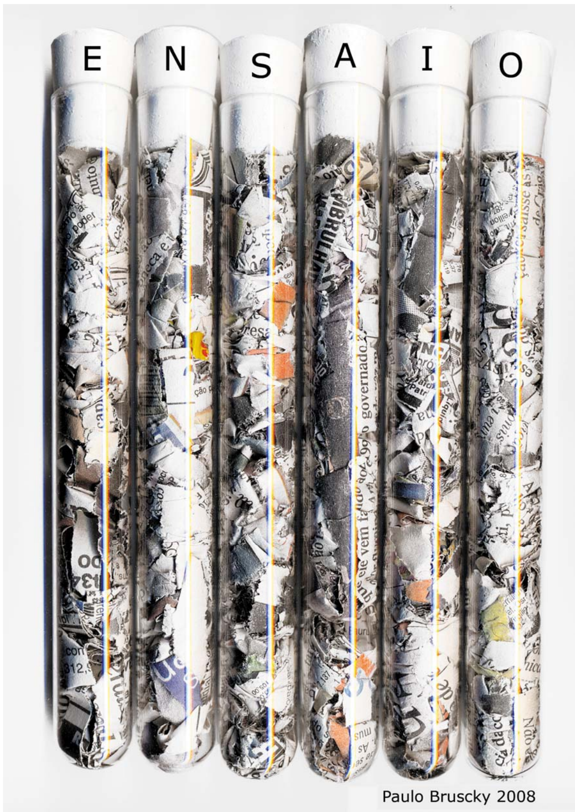
Paulo Bruscky 2008

Ensaio (2008) Paulo Bruscky Recife, Brasil. 1949. Centro de Poesía Visual Peñarroya-Pueblonuevo