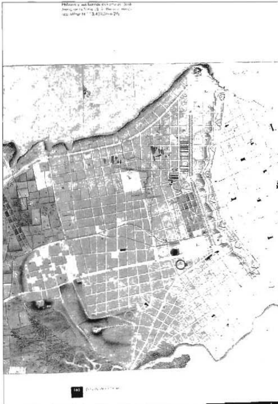
Expansión extramuros de la Habana según plano de José M. o de la Torre de 1812