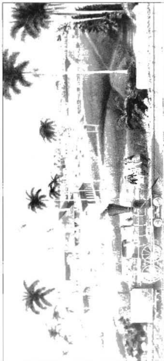
Ingenio azucarero con terracarril, en las proximidades de La Habana, a mediados del siglo XIX