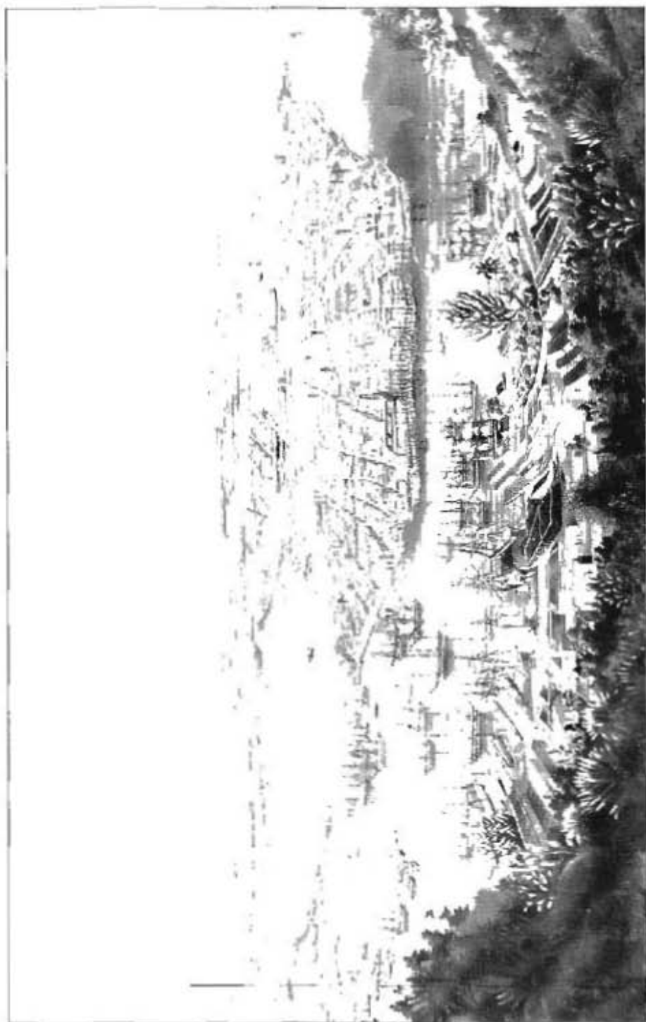
Puerto y ciudad de la Habana según litografía del siglo XIX