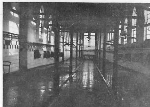
Matadero de Tetuán, nave de sacrificio.

A partir del año 1955, las vacantes que se producían en los Veterinarios Militares afectos a los Servicios de Ganadería, fueron cubiertas