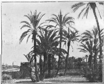
Palmera! de Marraquex.

Estos profesionales de los Servicios de Ganadería rinden un servicio de tal calidad, por lo que se refiere al progreso ganadero de la Zona, que ello obliga a procurarles, y la Superioridad no está remisa en ello, el bienestar moral y material a que se hacen acreedores por su laboriosidad e intenso celo en pro de una de las mayores riquezas de la Zona: la Ganadería.