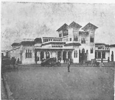
Matadero y mercado de Larache.