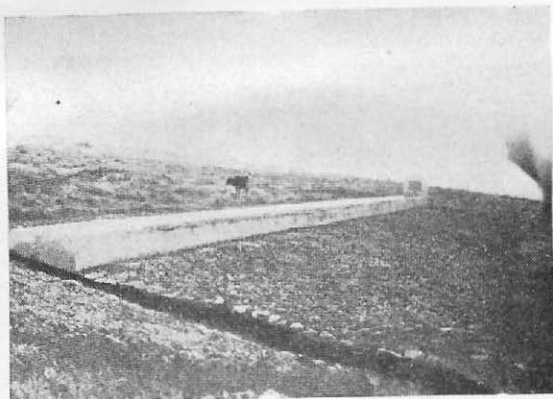
Fuente abrevadero de Jolot en Beni-Gorfet.

Estas Paradas, tanto las oficiales como las particulares, están dotadas de caballos y gara-