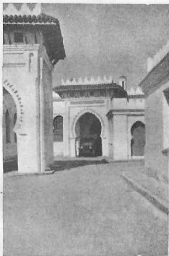
Aspecto parcial del Matadero de Tetuán.

Como consecuencia de esta organización, se hizo precisa la habilitación de los locales y construcción de Consultorios Veterinarios diseminados por toda la Zona y dotados de toda clase de material necesario para el mejor desarrollo de su funcionamiento.