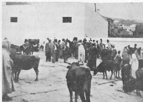
Día de mercado o zoco en el Matadero de Tetuán.

nen a su cargo todos los Servicios de Higiene y Sanidad Pecuaria, fomento ganadero e inspección de mataderos rurales, mercados y todo cuanto se relacione con la alimentación del hombre.