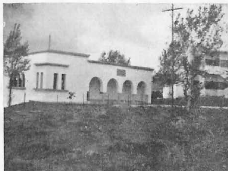
Consultorio Veterinario en el Zoco del Jemis de Anyera.

en relación directa con las necesidades y al mismo tiempo que éstos se desarrollaran de acuerdo con los señores Interventores, los cuales eran los directores de la política a seguir en sus diferentes modalidades, se creó un Cuerpo de Veterinarios Militares afectos a las diferentes Intervenciones Comarcales dependientes de la Delegación de Asuntos Indígenas, dando una verdadera organización a estos servicios.