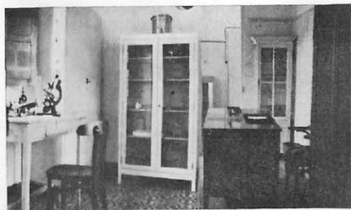
Laboratorio en el Consultorio del Zoco del Jemis de Anyera.

Como es fácil suponer, todos estos cargos estaban desempeñados por los Veterinarios militares que en su mayor parte habían prestado sus servicios con