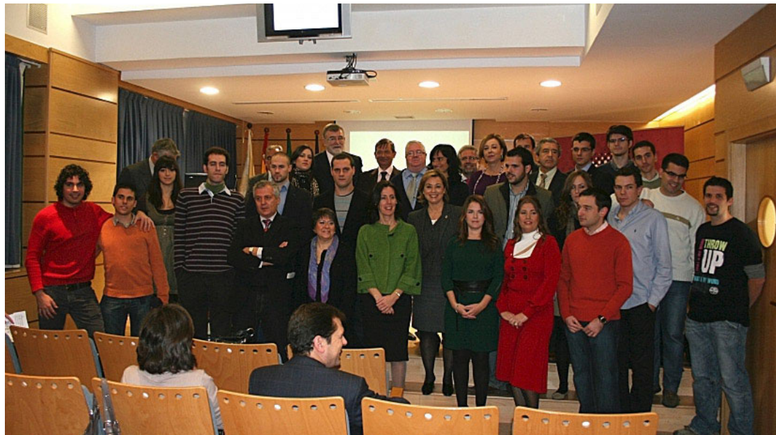
Premiados en la V Edición del Concurso de Ideas de Negocio de la UCO

Este año se han presentado un total de 46 ideas, 9 en la modalidad de personal docente e investigador (PDI), 10 en personal administrativo y servicios (PAS) y 27 estudiantes, aumentado ligeramente la participación con respecto a convocatorias anteriores. ■