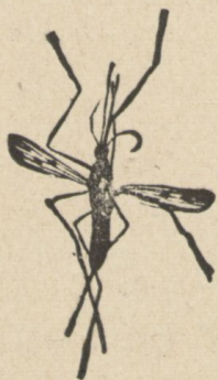
ANOFELE. Mosquito que propaga la fiebre palúdica.

Previene el paludismo y le cura en todas sus formas