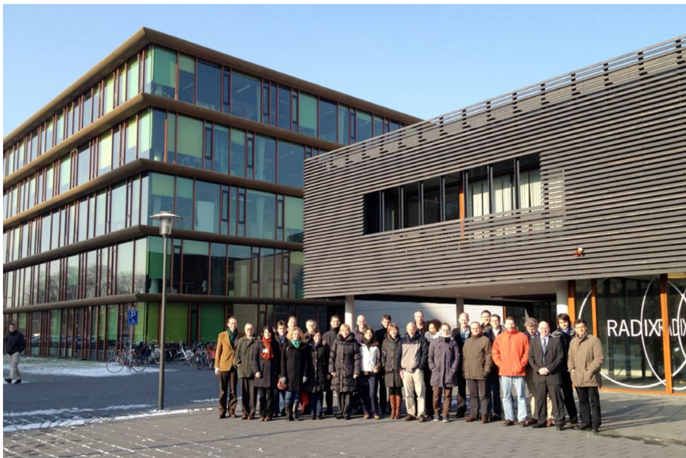
Reunión de inicio del Catch-C (Wageningen, Países Bajos)