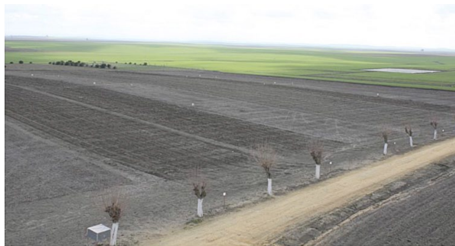
Ensayo de larga duración utilizado en el Catch-C (Sevilla, España)

Estos resultados sobre buenas prácticas de manejo y su viabilidad en diferentes tipos de explotaciones y ambientes crearán una conciencia sobre las ventajas e incon-